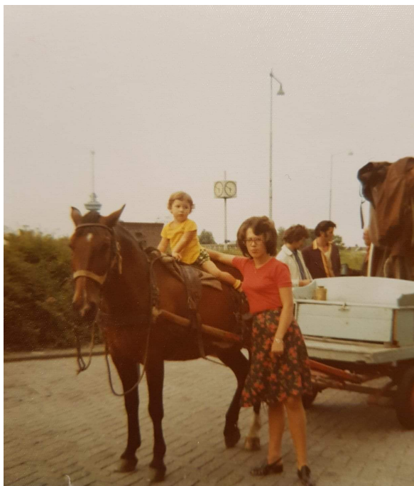
Op het paard van “Piet de Orgeldraaier” voor Café ‘t Vinkje