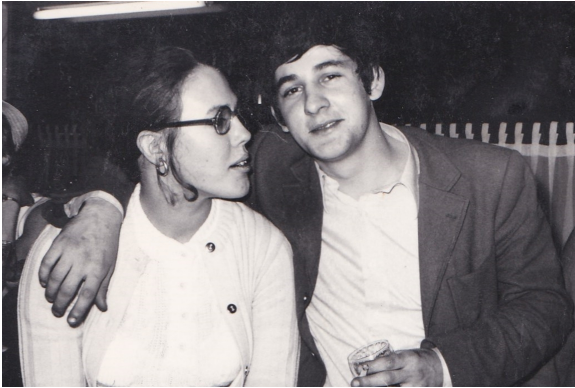
Ma & Pa