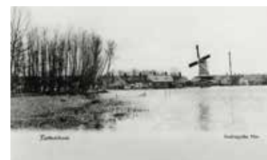
↑ Kralingse Plas met op de achtergrond molen Het Lam