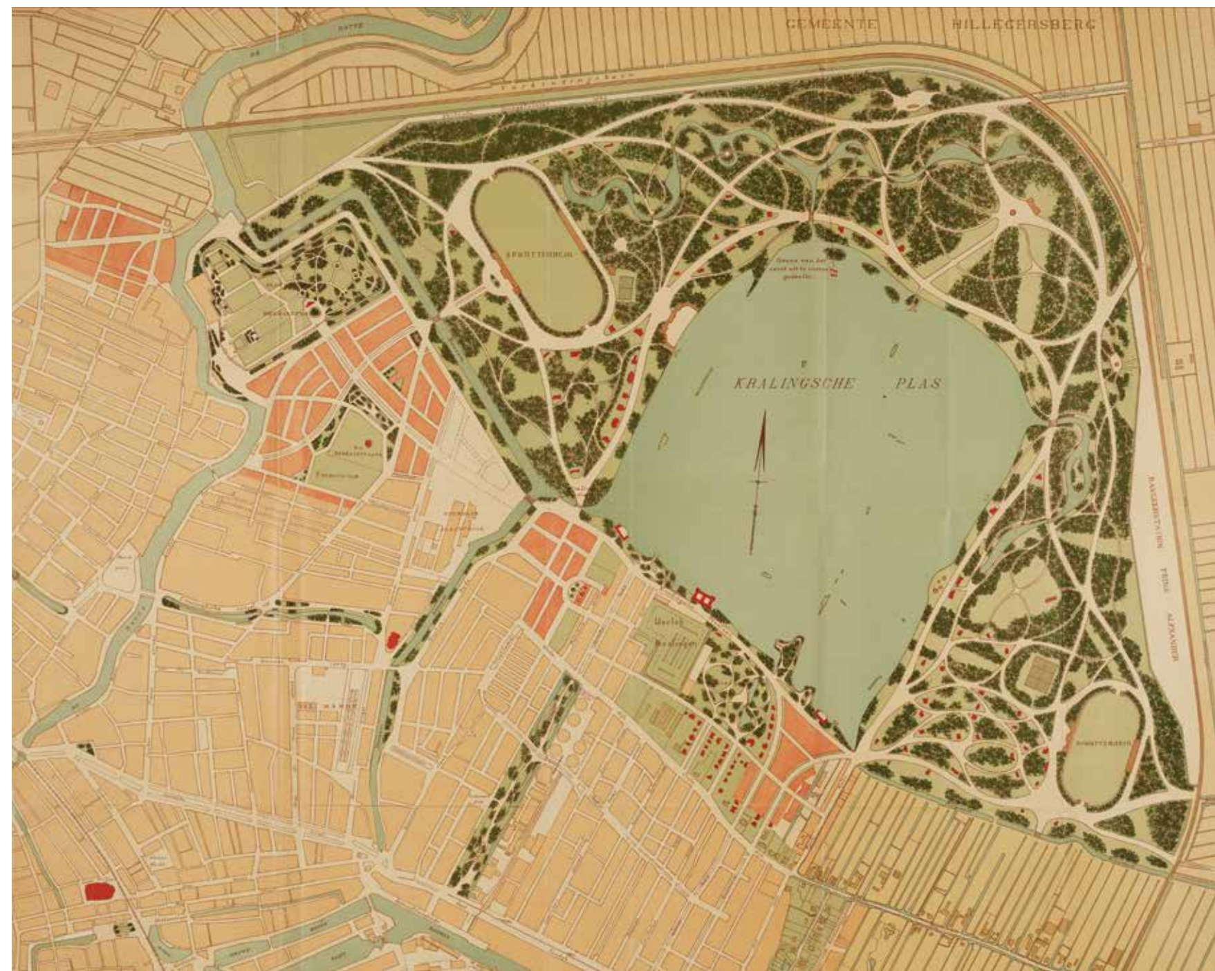
↑ Ontwerp van De Jongh, 1911

Maar toen na 1850 de turfwinning op zijn eind liep – inmiddels was steenkool beschikbaar – werd het besluit genomen de veenplassen droog te leggen. Niet alleen voor de volksgezondheid; het vele water veroorzaakte cholera-epidemieën, twee achter elkaar begin negentiende eeuw, maar ook voor een nieuw stadsdeel voor de uitdijende Rotterdamse bevolking: de Prins Alexanderpolder. Tussen 1865 en 1876 werden de plassen drooggemalen. Op een plas na. De Noordplas in Kralingen, dat toen nog een zelfstandig dorp was. Drooglegging ervan stuitte op problemen. Door de diepte van de plas, dieper dan de andere, die het kostbaar maakte deze droog te malen. Door de molens en fabrieken die er aan la-