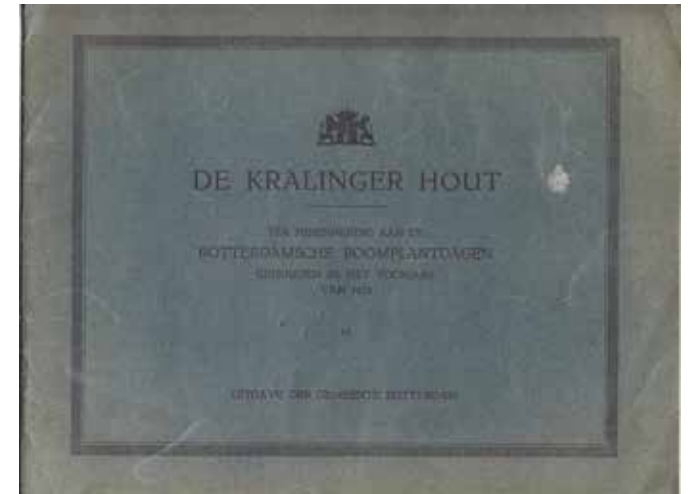
Boekje dat scholieren meekregen bij de boomplantdagen

beurt. Honderden uitgelaten planters die de jonge eiken in de kuilen plaatsen. Een flinke emmer water erover en klaar.