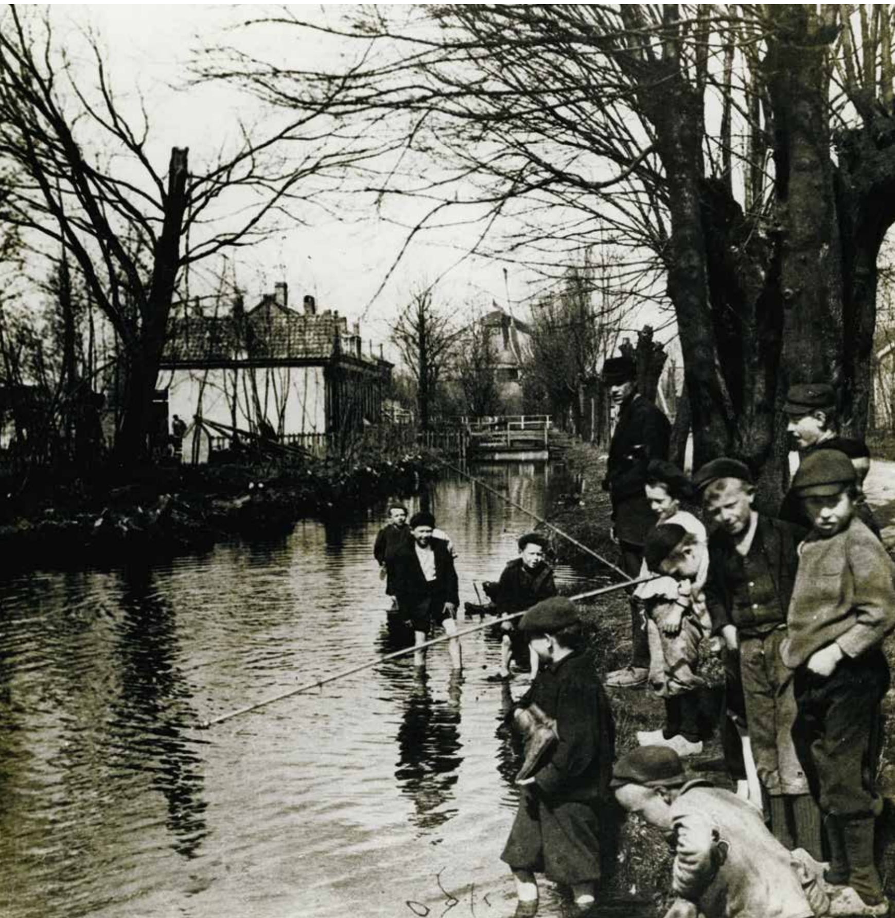
← Kortekade (nu Plaszoom) met op de achtergrond molen De Ster, rond 1910