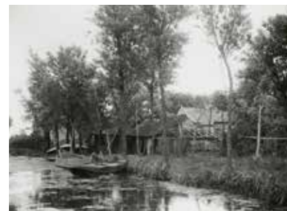
↓ Dijkje langs de Kralingse Plas rond 1900, hier: hoek Bosweg, Langekade