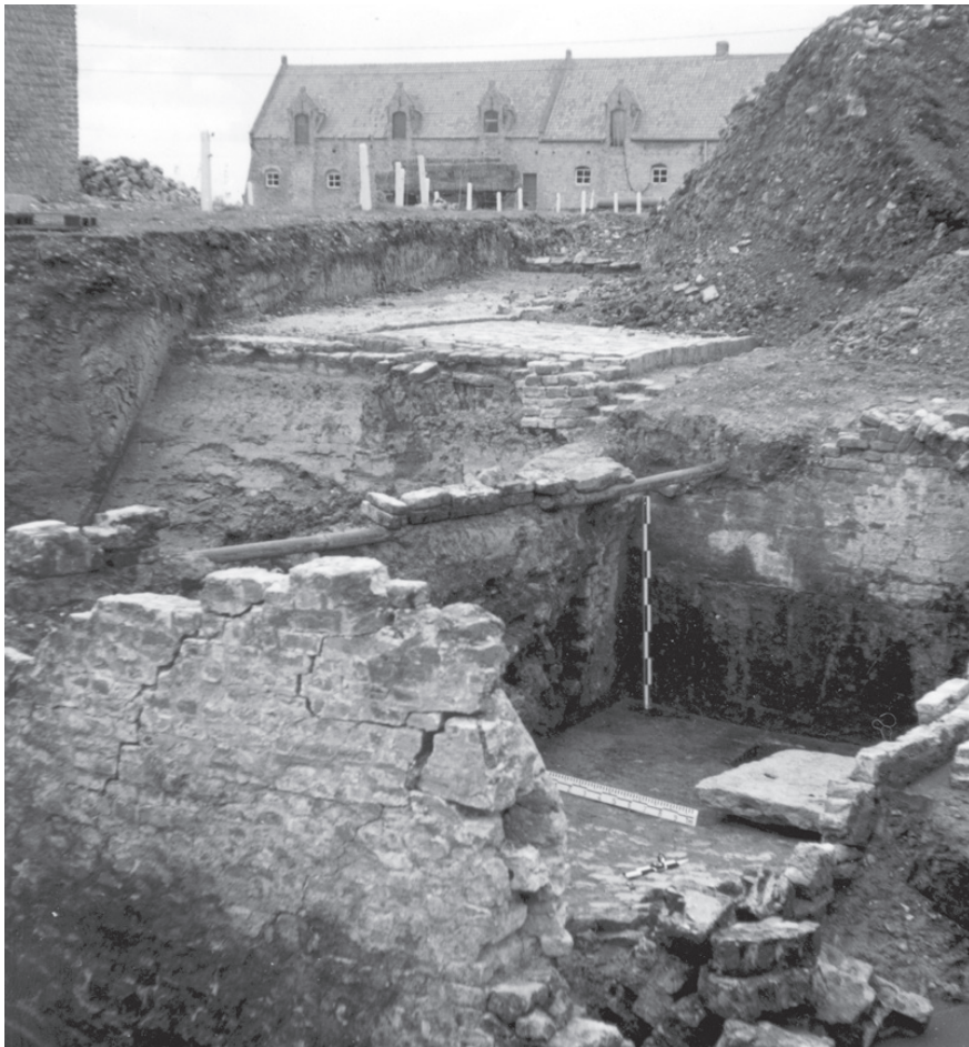
Het Groot Tempelhof in Slijpe: in de negentiende eeuw en tijdens de opgravingen van 2002