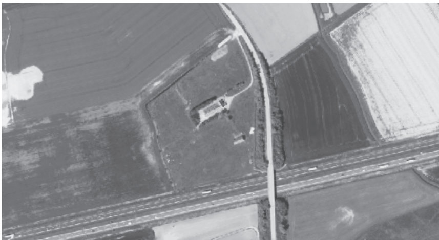
Het Groot Tempelhof in Slijpe: in de negentiende eeuw, na de Groote Oorlog en vandaag