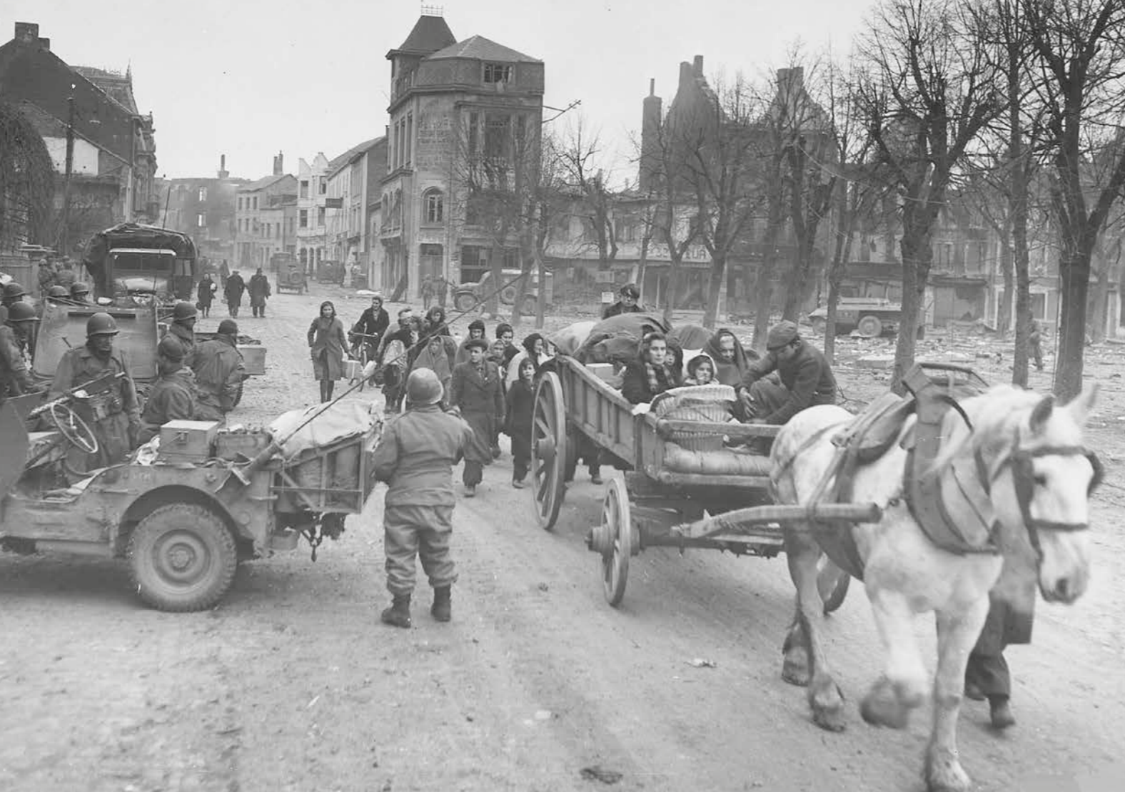
Boven: Vluchtelingen verlaten Bastogne. Ze zijn op het centrale plein dat nu is vernoemd naar bde.-gen. Anthony McAuliffe.