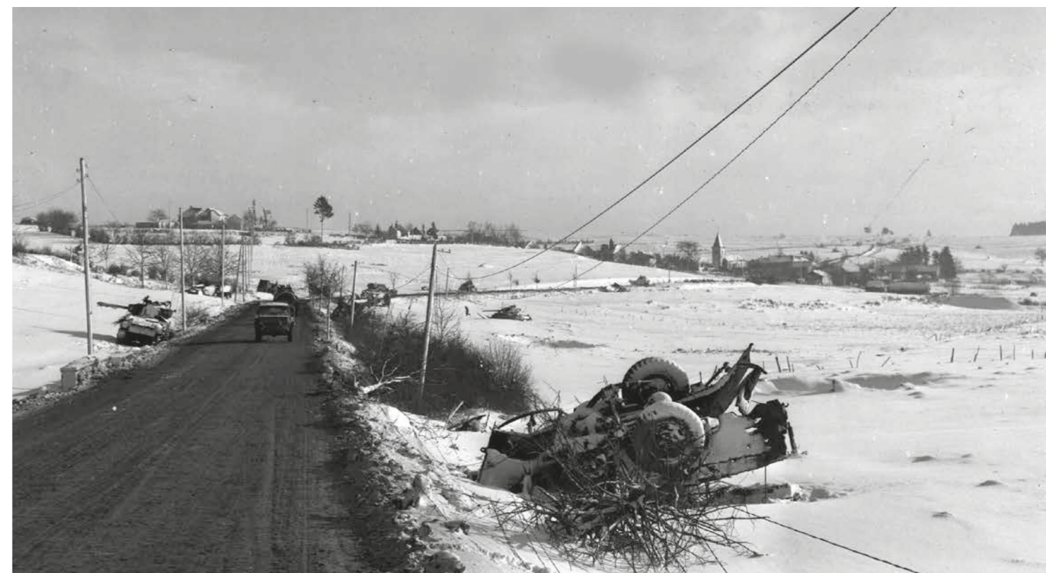
Links en midden: Een andere foto van het 1e bataljon, 506e PIR dat uit Noville vertrekt om Team Desobry te gaan steunen. De Duitse 5e Panzerarmee en het XLVII Korps stonden onder druk van het opperbevel om voorbij Bastogne op te rukken en besloten dat Panzer-Lehr Bastogne moest innemen en de andere eenheden verder naar het westen moesten trekken. De omsingeling van Bastogne werd op de 21e voltooid, maar Mitchell zegt: 'Hoewel de 101e was omsingeld, was ze niet geïsoleerd.' Panzer-Lehr voltooide zijn missie niet op 20 december en probeerde het samen met de 26e VGDiv op de 21e opnieuw. De verdedigingslinie kromp, maar hield stand. In de nacht van de 21e besloten Von Manteuffel en Heinrich Freiherr von Lüttwitz, de bevelhebber van het XLVII Korps, om een brief te sturen naar de bevelhebber van het garnizoen in Bastogne.