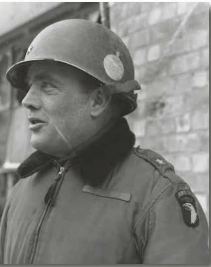
Boven: Omdat Maxwell Taylor bij een stafvergadering in de VS was toen de Duitsers aanvielen, nam de plaatsvervangend divisiebevelhebber, bde.-gen. Anthony C. McAuliffe, het bevel over. Voor zijn acties in Bastogne kreeg hij op 30 december 1944 het Distinguished Service Cross. Later kreeg hij de Distinguished Service Medal. Op 15 januari 1945 werd hij gepromoveerd tot generaal-majoor en kreeg het bevel over de 103e InfDiv. Hij bleef na de oorlog in dienst en ging in 1956 met pensioen.