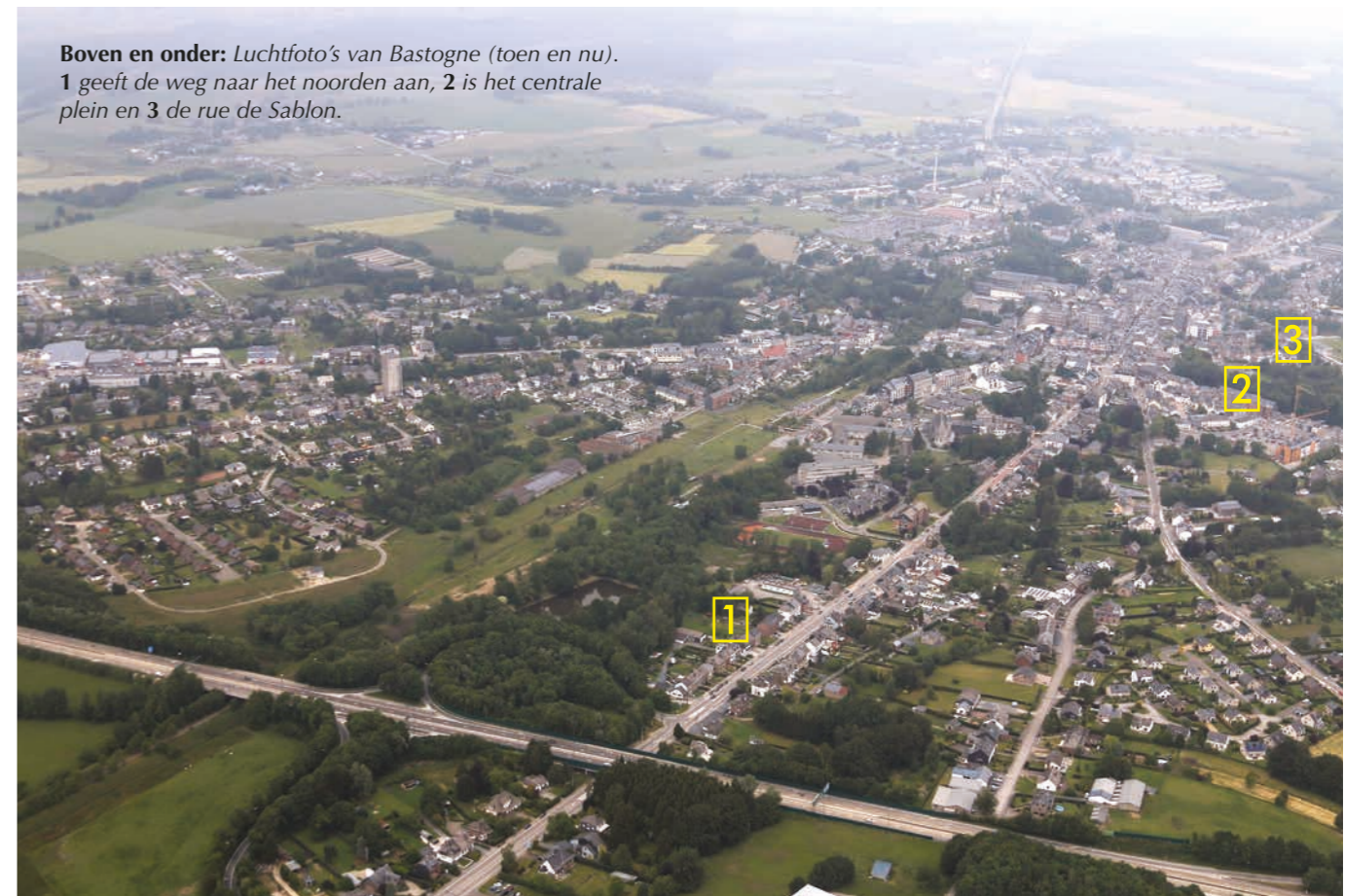
Boven en onder: Luchtfoto's van Bastogne (toen en nu). 1 geeft de weg naar het noorden aan, 2 is het centrale plein en 3 de rue de Sablon.