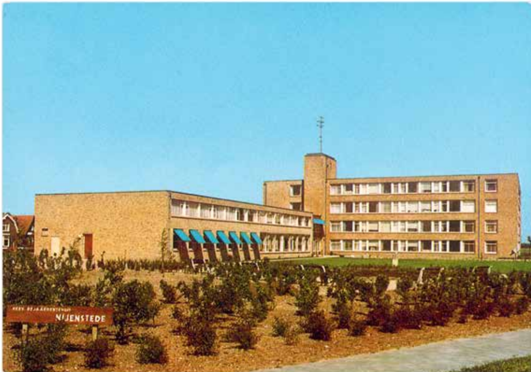
Herv. Bejaardentehuis Nijensteede, Steenwijk