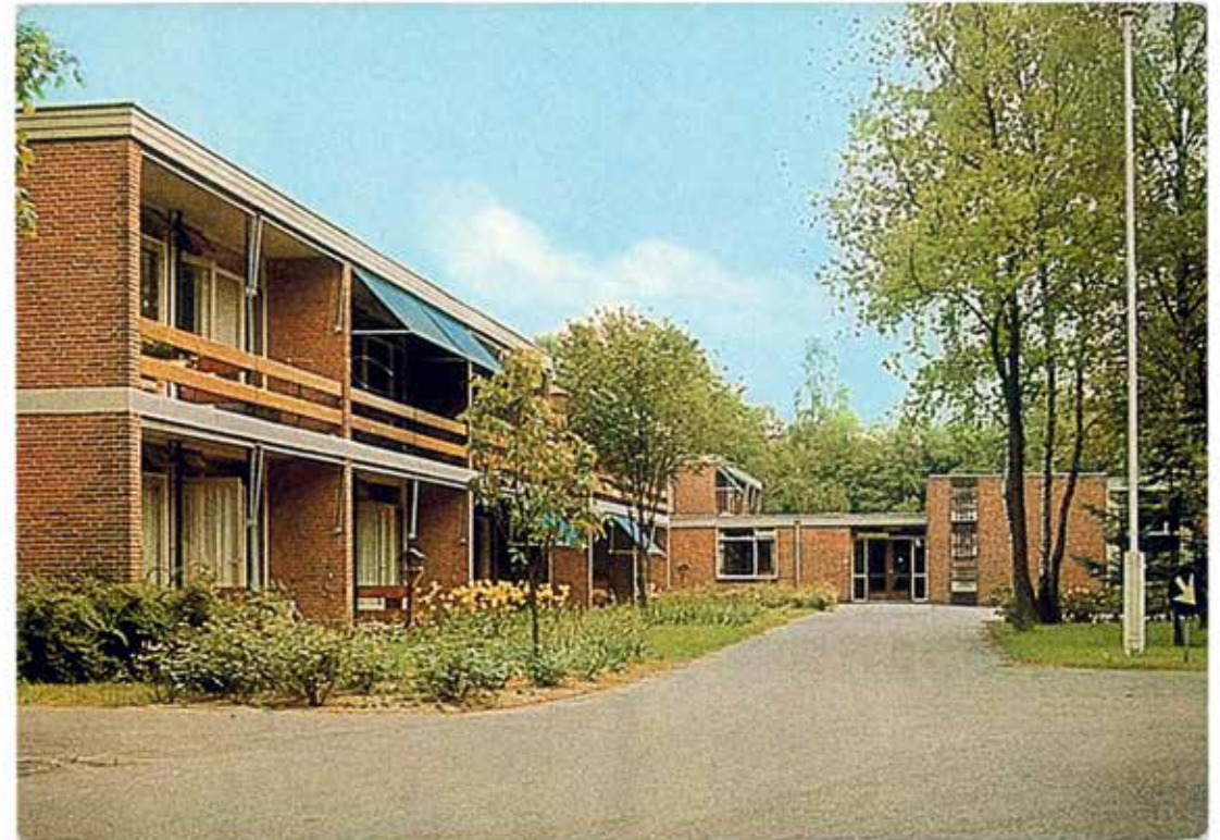
St. Geref. Bejaardencentrum d'Amandelboom, Bilthoven