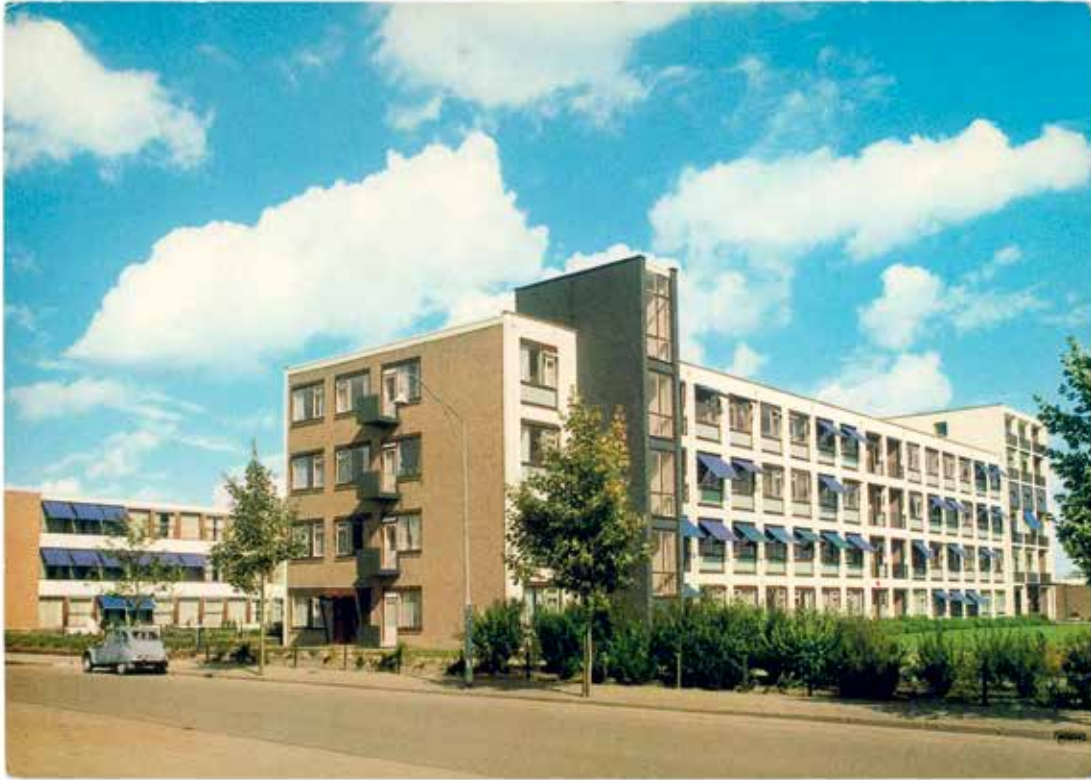
Verpleeghuis Ter Valcke, Goes