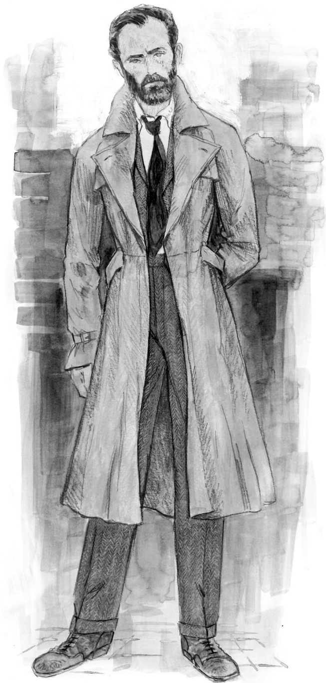
(BOVEN) KOSTUUMSCHETS ALBUS PERKAMENTUS (RECHTS) OPZET DOSSIER VAN ALBUS PERKAMENTUS MET OPENGELATEN RUIMTE VOOR BEWEGENDE FOTO'S