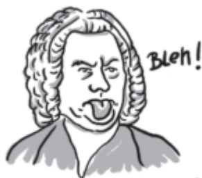
Johann S. Bah!