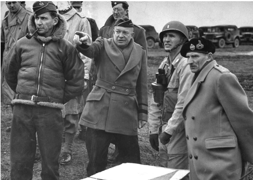
Eisenhower (wijzend) en Montgomery (uiterst rechts).

En dan stopt de opmars. De bevoorrading lukt niet meer. De opmars gaat zo snel, dat het voor de logistiek niet meer bij te houden is. Bovendien, niet onbelangrijk, de beide opperbevelhebbers, generaal Montgomery van de Britten en generaal Eisenhower van de Amerikanen, verschillen grondig van mening over hoe nu verder. Montgomery wil de Rijn over en Duitsland in, maar Eisenhower durft dat niet aan, ook al vanwege de gebrekkige aanvoer van troepen en materieel. Antwerpen is weliswaar in hun handen gevallen, en daarmee ook de haven, maar de toegang tot die haven wordt nog steeds door de Duitsers beheerst. De Nederlandse oevers van de Westerschelde zijn nog steeds in Duitse handen.