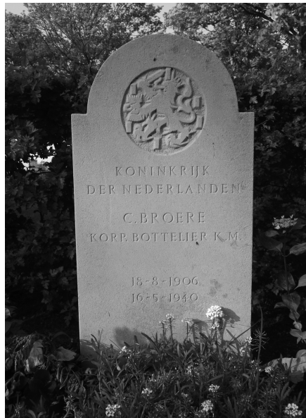
Het graf van korporaal Cornelis Broere op de Noorderbegraafplaats in Vlissingen.