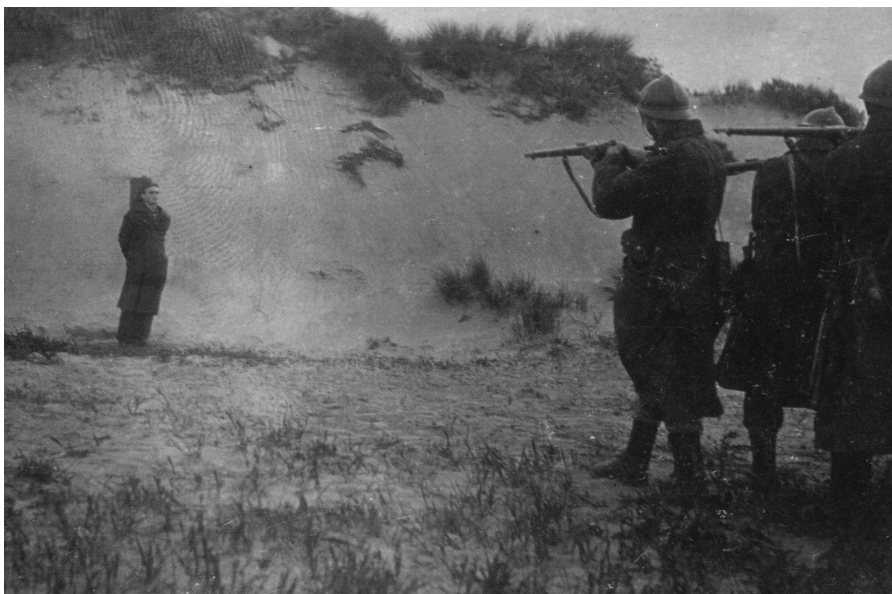
De executie van de Vlaamse soldaat Alois Walput op 3 juni 1918 op het strand van Koksijde.

De internationaal toonaangevende militair historicus Martin van Creveld uit Jeruzalem vermeldt in zijn boek Fighting Power uit 1982, dat leiding bestaat uit een combinatie van voorbeeld en overreding. Als beide falen moet geweld worden gehanteerd. Zonder een ordelijk rechtssysteem dat de wet snel en efficiënt uitvoert, kan geen organisatie functioneren, om van een militaire organisatie maar geheel te zwijgen. 1 Discipline is een belangrijke factor voor de gevechtskracht. Worden hier de wetten overtreden, dan krijgt de militair te maken met het militaire strafrecht. Een strafrecht dat reeds bestond in de Romeinse legers. Met het ontstaan van centrale overheden kreeg de staat met haar politie- en militaire macht, het monopolie op geweld. Hiermee ontstonden de centrale rechtsregels zoals het Burgerlijk Wetboek en het Militaire Wetboek (Militaire Straf- en Tuchtrecht). In de 17e en de 18e eeuw kwamen de eerste verzamelde wetboeken voor de militaire justitie. Klassenjustitie