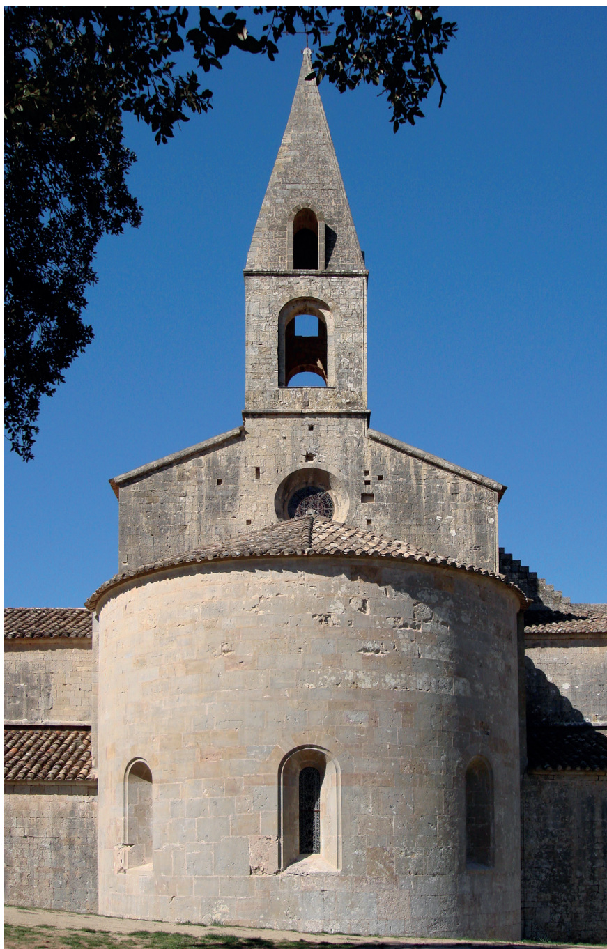
Cisterciënzer abdij Le Thoronet, kerk met absis, 12de eeuw