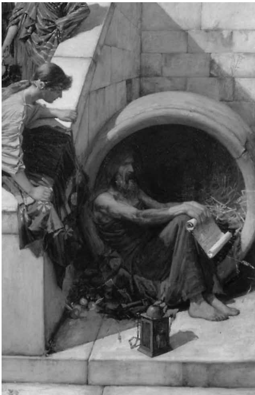
Diogenes van Sinope