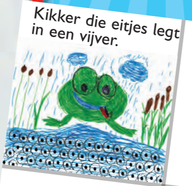
Kikker die eitjes legt in een vijver.

Hoe lang is de kikker? Meet hem met een liniaal.