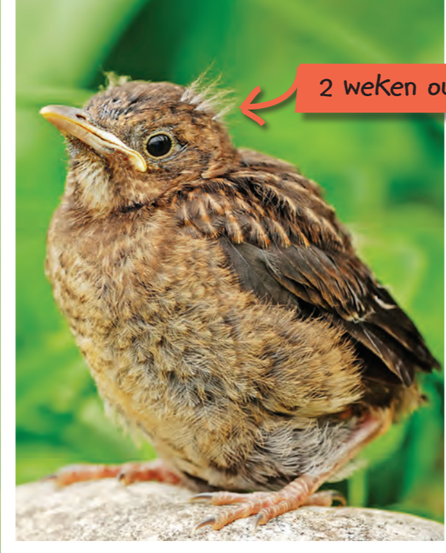
2 weken oud

De jongen kunnen nu zien en hun veren groeien.