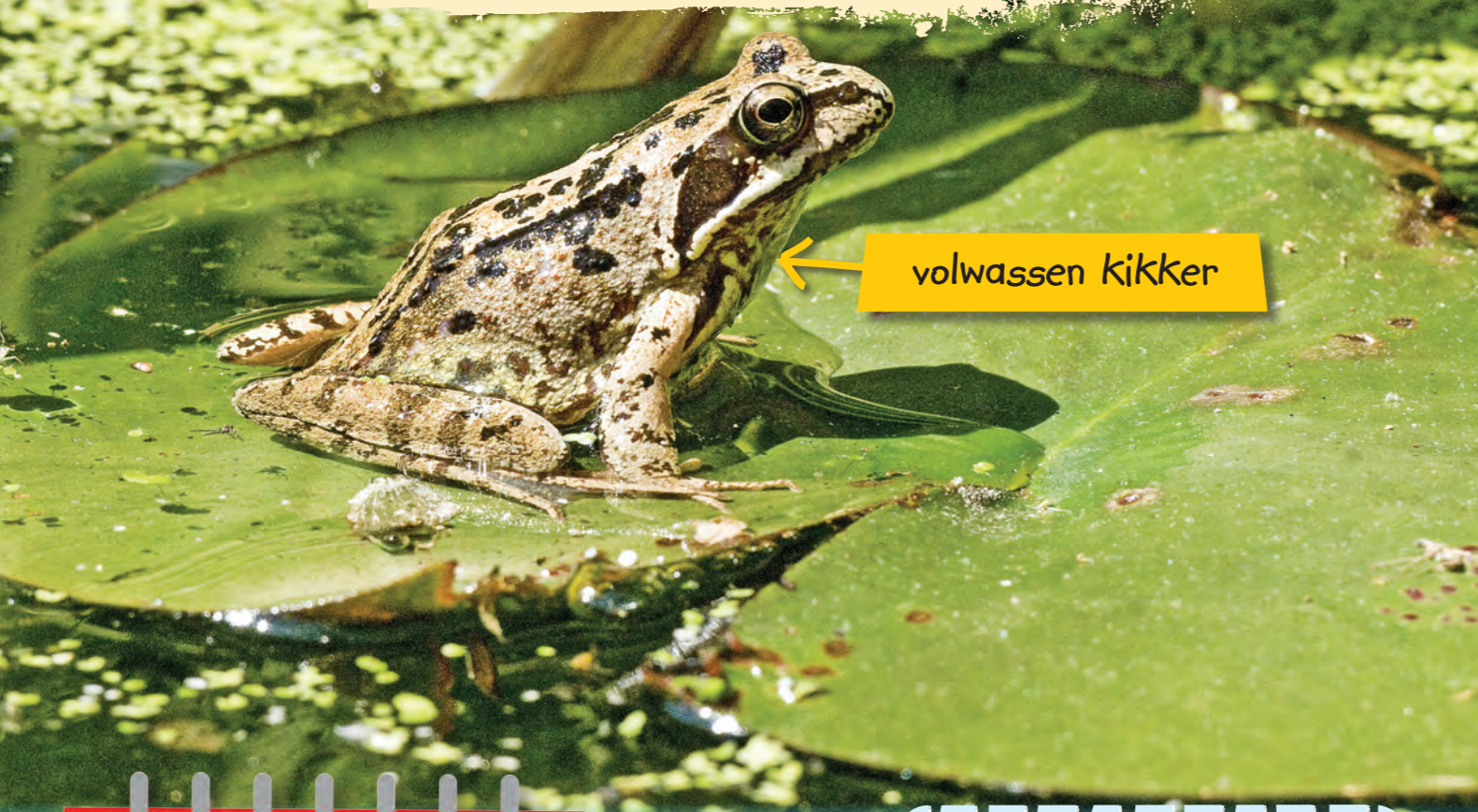
← volwassen kikker

De kikker blijft groeien tot hij volwassen is.