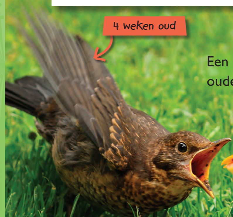
4 weken oud

Een mereljong blijft bij zijn ouders tot het 6 weken oud is.