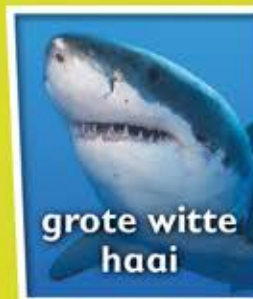
grote witte haai