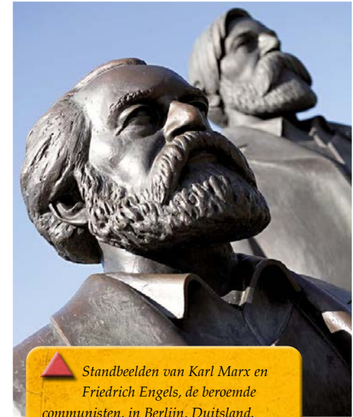
Standbeelden van Karl Marx en Friedrich Engels, de beroemde communisten, in Berlijn, Duitsland.

De Duitse filosoof Karl Marx zag deze grote verschillen in de samenleving en vond dat de maatschappij oneerlijk in elkaar zat. Hij besloot dat het helemaal moest veranderen. Marx ging aan het werk met zijn vriend Friedrich Engels, een andere Duitse filosoof, en schreef een kritische verklaring tegen het kapitalisme. Er moest een nieuw soort maatschappij komen, stond er in te lezen, een communistische maatschappij. Deze verklaring kreeg de naam het Communistisch Manifest en werd gepubliceerd in 1848. Het was een oproep aan de arbeiders van de wereld om samen te vechten tegen het kapitalistische systeem en de machthebbende klasse. Kortom, een revolutie – een snelle verandering – was nodig! Weg met het kapitalisme, en op naar het marxisme!