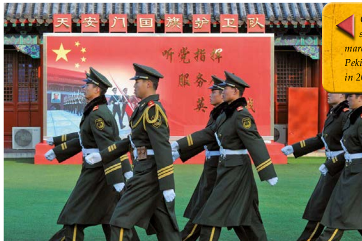
Chinese soldaten marcheren door Peking, China, in 2012.

De bovenklasse bezit vaak bedrijven en grond en is dus rijk – en vaak ook heel machtig. De midden- en onderklasse hebben minder geld en geen macht, en ze moeten hard werken om genoeg te