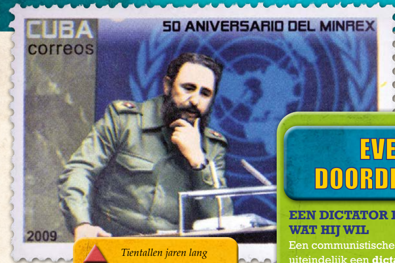
Tientallen jaren lang was Fidel Castro de communistische leider van Cuba.

verdienen voor eten en onderdak. In een communistische maatschappij heeft de regering alle touwtjes in handen, vooral als het om handel gaat, en de economie . In de regering van een communistisch land zit maar één partij, de communistische partij. Het idee was: niemand in een communistisch land bezit in z'n eentje grond of geld. Alles is van iedereen, van het volk.