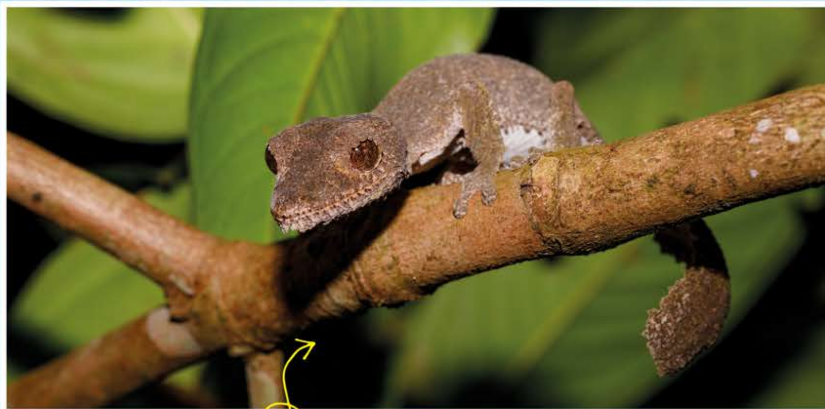
Een gekko van het eiland Madagaskar