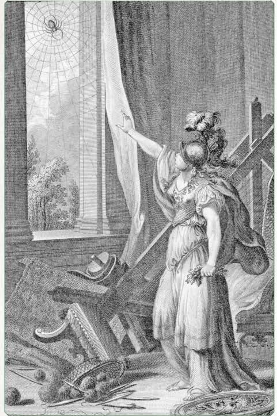
Minerva is niet gelukkig met Arachne's wandkleed en verandert haar in een spin.

wandkleed een kleed voor aan de muur met een afbeelding of patroon erop