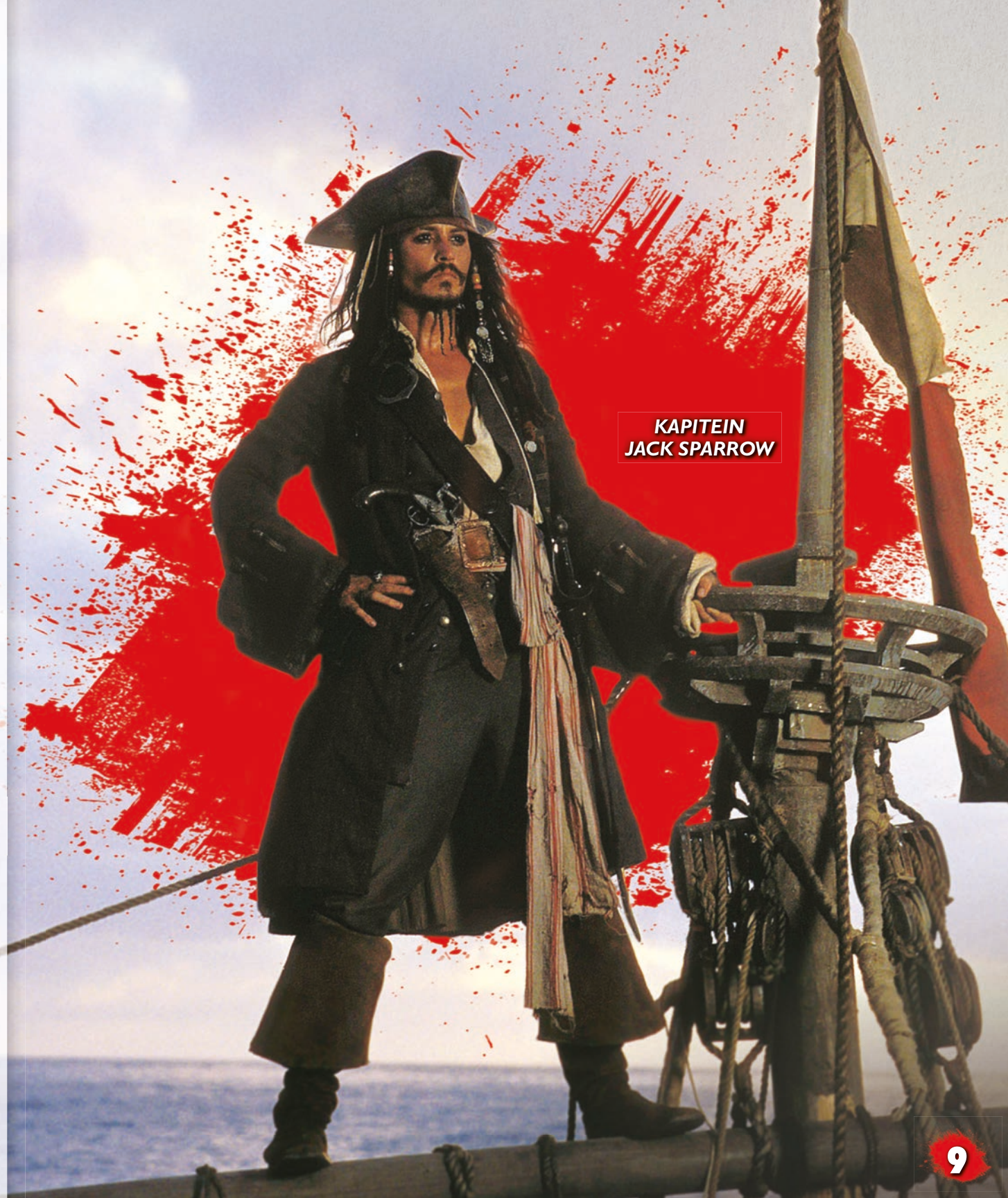
KAPITEIN JACK SPARROW