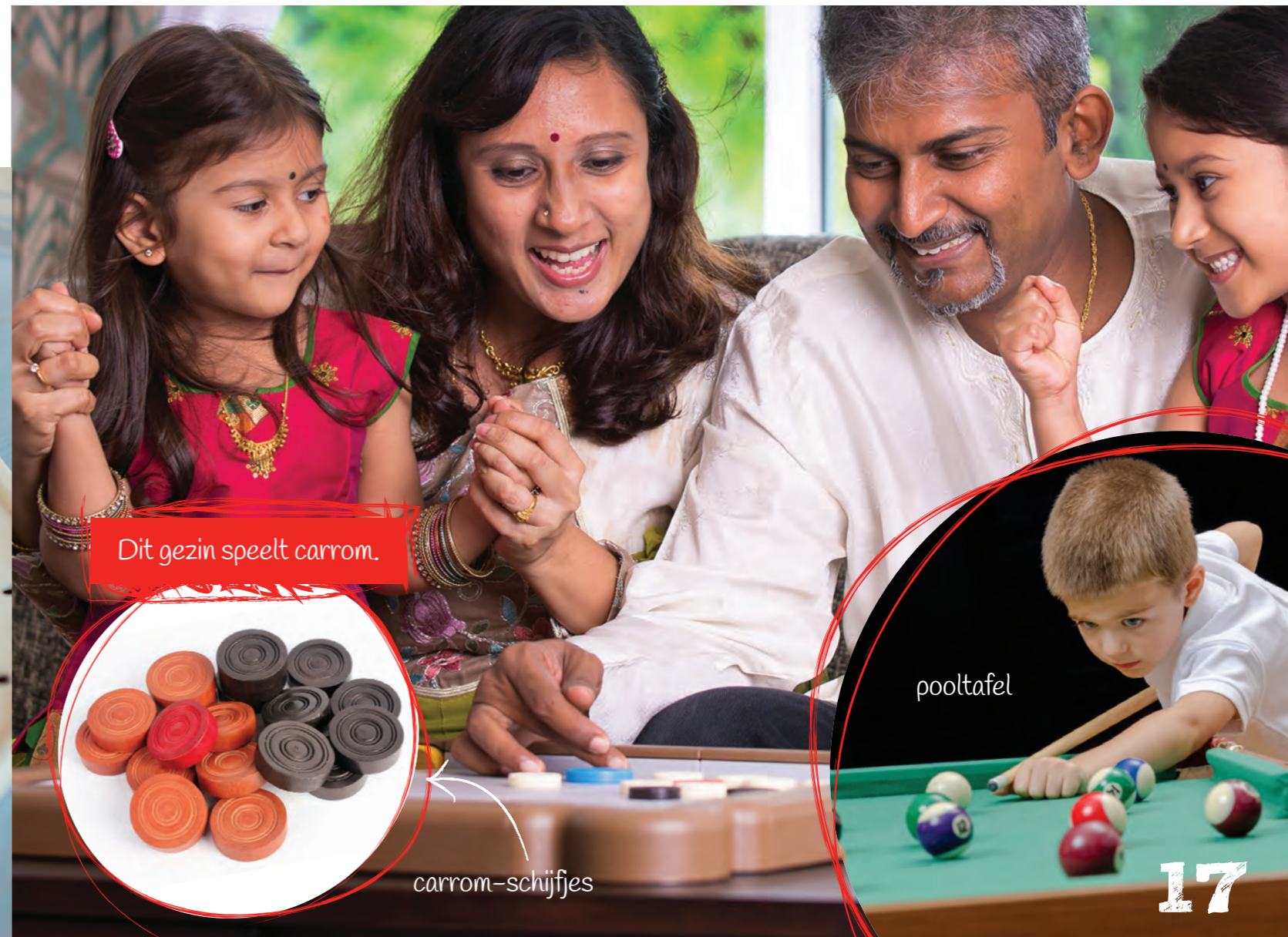
Dit gezin speelt carrom.

Carrom is een spel uit India. Dat spel lijkt op een mix van sjoelen en poolen. Met je eigen schijfje kaats je andere schijfjes van het speelbord af. De speler die als eerste alle schijfjes van het bord kaatst, wint.