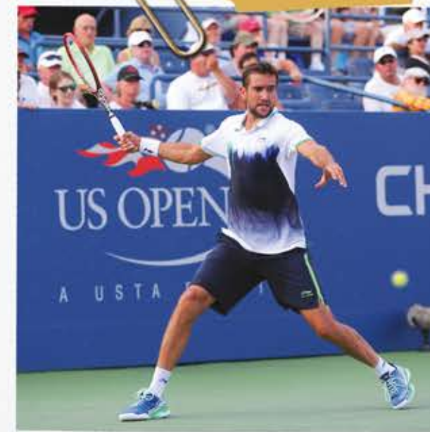
Čilić wint de US Open in 2014.