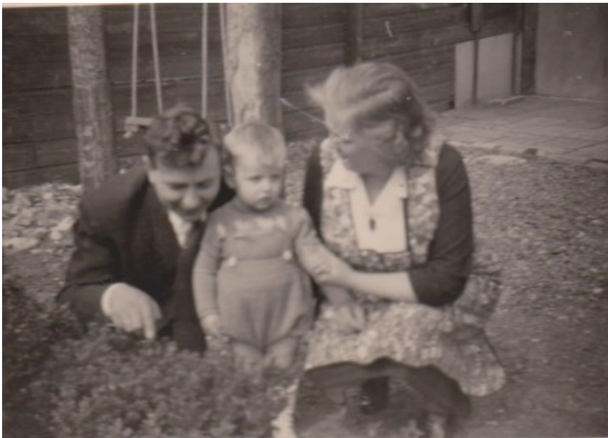
Met mijn ouders in de achtertuin.