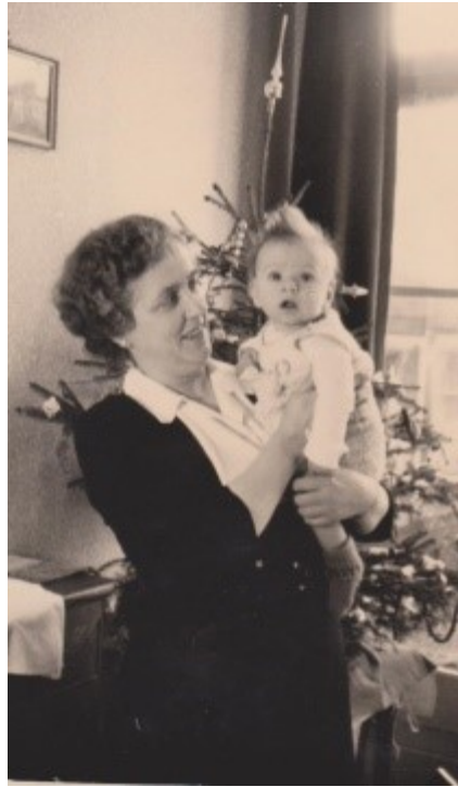
Mijn eerste kerst 1953.

Toen ik geboren werd woonden we aan de Herman Costerstraat in Den Haag.