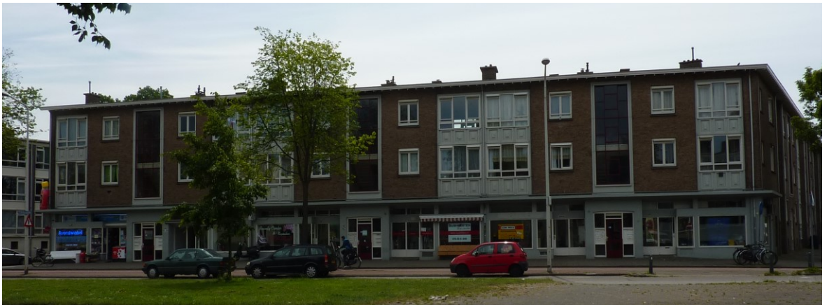
De winkeltjes in 2016. Uiteraard hele andere dan in 1959.

verhuisd. Dat was een huis op de eerste etage. Omdat de muizen, afkomstig van de Haagse markt, zich bij ons in huis erg thuis voelden, kwamen ze vaak op visite.