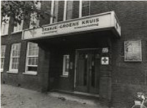
Ingang kraamkliniek anno 2016.

Ik kwam ter wereld in de kraamkliniek op de La Reyweg in Den Haag. Mijn vader liep in alle opwinding over de aanstaande geboorte van zijn vijfde kind, bij het uitstappen uit de taxi, tegen een boom. Omdat hij niet doorhad dat het een boom was zei hij keurig 'sorry' tegen de boom.