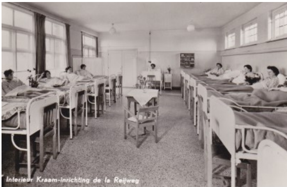
De zaal omstreeks 1953.