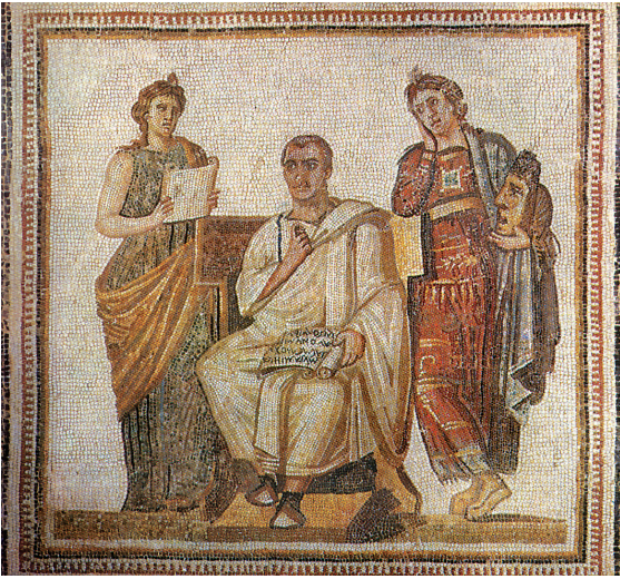
1.2. Vergilius met twee Muzen. Mozaïek uit Carthago (Tunis).

gedichten trok hij de aandacht van Maecenas, een invloedrijke promotor en sponsor van de kunsten, die hem bij Octavianus, de latere keizer Augustus, introduceerde. Deze toonde grote belangstelling voor het werk van de dichter. Vergilius behoorde voortaan tot de vaste kring van