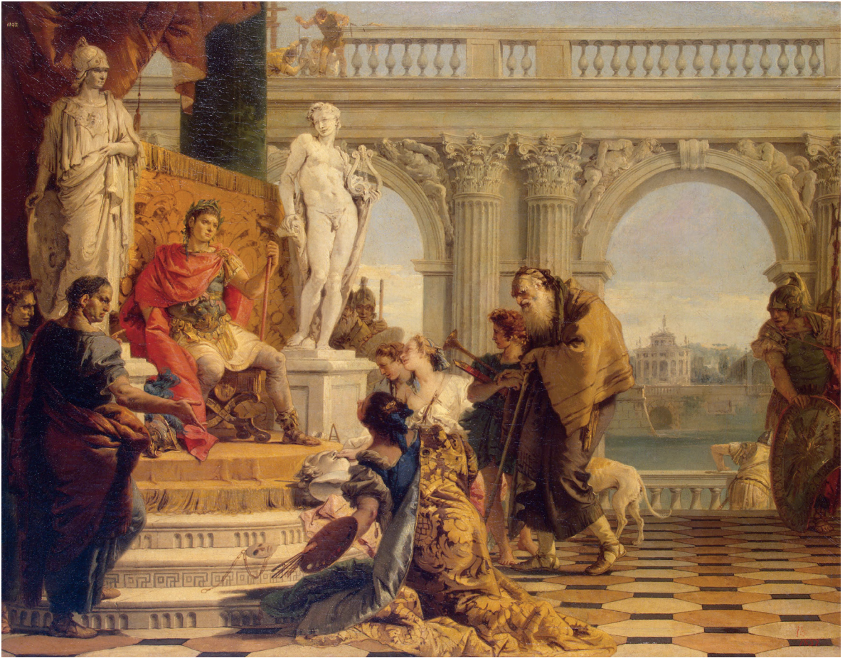
1.4. Maecenas presenteert de gepersonificeerde kunsten aan keizer Augustus. Schilderij van Giambattista Tiepolo uit ca. 1745.

Een herder vertelt dat hij zijn land moet verlaten vanwege de onteigeningen na de burgeroorlogen, een ander mag juist op zijn land blijven. Het laat zich aanzien dat Vergilius in deze gedichten zijn eigen ervaringen verwerkt.