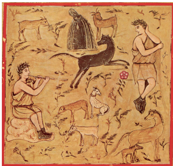
1.7. Twee herders met hun vee. Miniatuur bij het derde boek van Vergilius' Georgica in een 5de-eeuws handschrift.

Vergilius schreef de Georgica in de jaren 38-29. Het is een didactisch werk, een leerdicht, over het boerenbedrijf, waarin achtereenvolgens in vier boeken gesproken wordt over de akkerbouw, de bos- en wijnbouw, de veeteelt en de bijenteelt. Ook al behoort het werk tot het genre van het leerdicht, dat wil zeggen dat de dichter zijn gedicht gebruikt om informatie en nuttige kennis over te dragen, toch heeft Vergilius elke associatie met een technisch handboek willen vermijden: er zijn geen lange voorwoorden, samenvattingen of argumentaties en bewijsvoeringen. Het werk is dan ook niet bedoeld als een praktische leidraad voor de kleine boer. De dichter wil de lezer vooral esthetisch genot verschaffen. Toch gaat het gedicht wel in grote lijnen over de praktijk van de kleine boer. Het is in de ogen van de dichter mogelijk dat een boer die over voldoende kennis van de natuur beschikt en in staat is te werken, een gelukkig leven bereikt. De Georgica geeft uitdrukking aan liefde voor het land en bewondering voor het een-