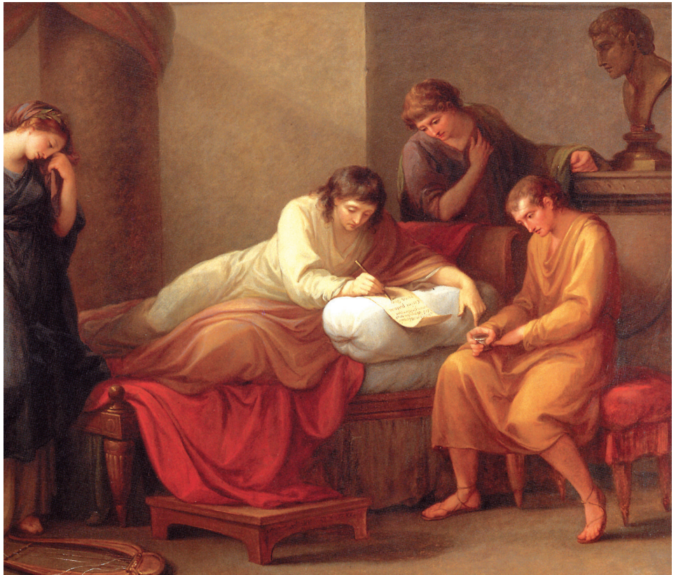
1.5. Vergilius schrijft op zijn doodsbed het opschrift voor zijn graf. Schilderij van Angelika Kauffmann uit 1785.