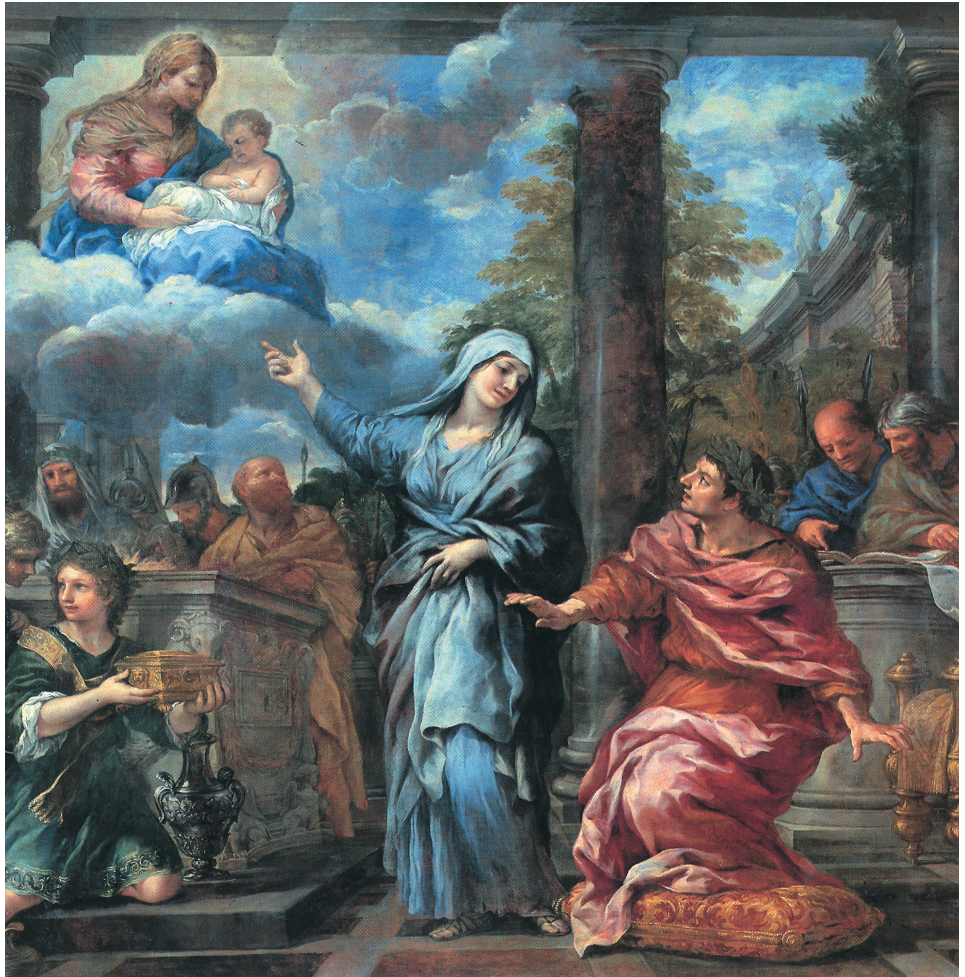
1.6. De Sibylle van Tibur kondigt keizer Augustus de geboorte van Christus aan. Schilderij van Pietro da Cortone uit 1660.