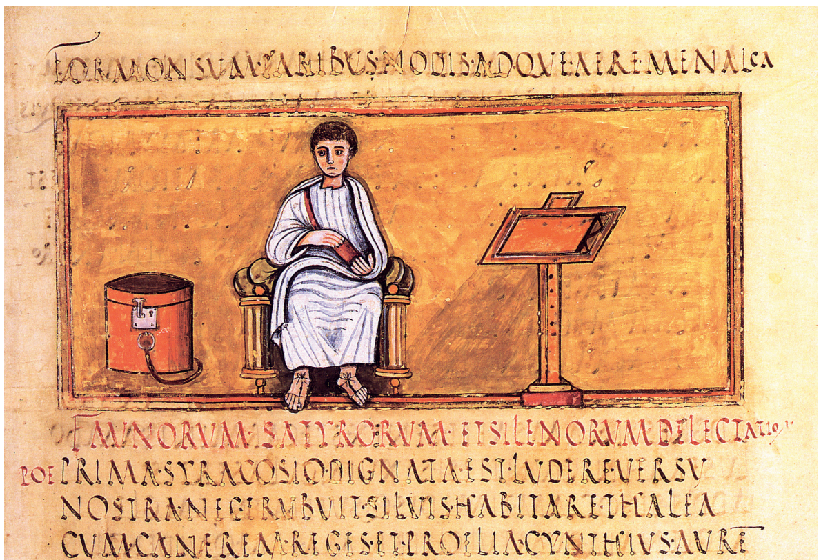
1.1. Vergilius. Illustratie in een Vergiliushandschrift uit ca. 400.

Op advies van deze Pollio begon Vergilius met het schrijven van tien gedichten over het herdersleven, Bucolica , 'herderszangen' geheten. Met deze