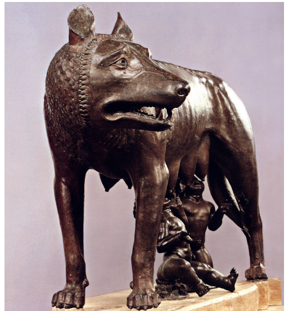
1.9. La Lupa Capitolina, het bronzen beeld van een wolvin en symbool van de stad Rome, werd tot voor kort als een Etruskisch meesterwerk uit de 5de eeuw v. Chr. beschouwd. Nu heeft men vastgesteld dat het in de Middeleeuwen is vervaardigd. De kindertjes Romulus en Remus zijn in de 15de eeuw door Antonio Pallaiuolo eraan toegevoegd.

Een tweede traditie die Vergilius overneemt, is het streven van Julius Caesar om zijn familie, de gens Iulia , op de godin Venus terug te voeren. Dit ging via Aeneas' zoon Ascanius die door de Romeinen ook Ilus of Julus werd genoemd. Zo werd Aeneas, de zoon van Venus, ook de stamvader van de familie van Julius Caesar en dus ook van diens achterneef en aangenomen zoon Octavianus. Toen Caesar in 44 werd vermoord, bleek Octavianus tot zijn verrassing per testament als Caesars zoon te zijn geadopteerd en tot diens erfgenaam benoemd. Hij erfde het vermogen van Caesar en diens familienaam. Door deze verbinding tussen Caesar en Octavianus kon de gens Iulia dus bogen op een godin, namelijk Venus, als stammoeder. Op deze manier werd de vergoddelijking van Julius Caesar en later die van Augustus als het ware gelegitimeerd. Via Aeneas verbond Vergilius dus de stichting van Rome en de familie van keizer Augustus met een mythisch verleden.