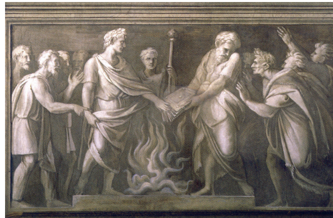
1.3. Augustus voorkomt het verbranden van de Aeneis . Fresco van waarschijnlijk Rafaël uit 1512-1513.

wijzingen naar de historische werkelijkheid. Zo hebben Ecloga 1 en 9 als thema de landverdeling.