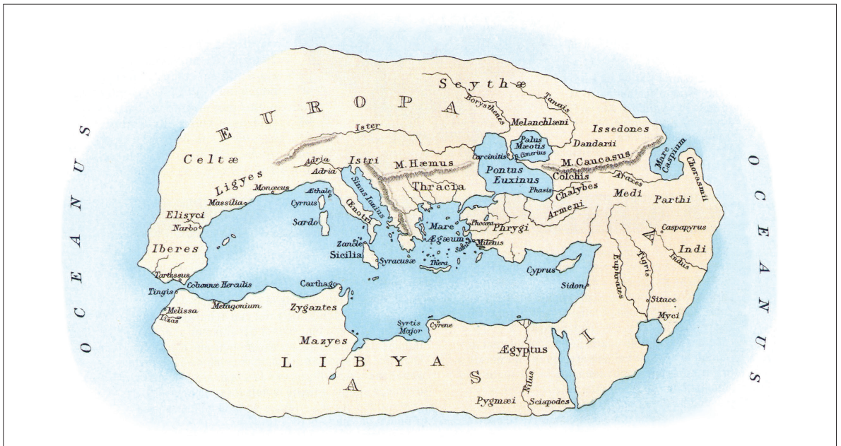
1.6. Het wereldbeeld van Hecataeus van Milete.

Het tweede werk van Hecataeus, de Genealogieën , toont de andere belangstelling van de logografen. Hoewel er ook van dit werk niet veel overgeleverd is, krijgt men de indruk dat het ging om een systematisch geordende behandeling van de helden-