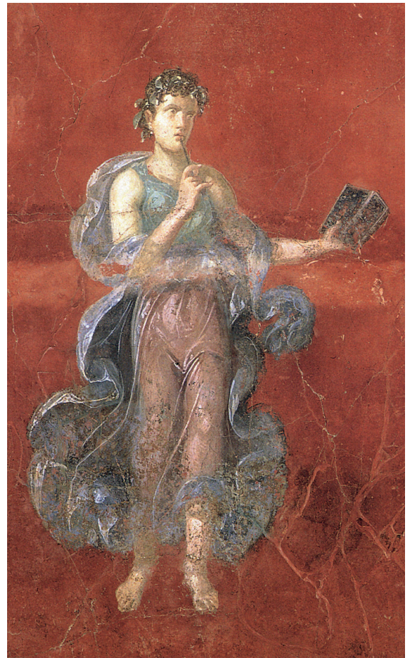
1.3. Calliope, de Muze van het epos. Romeinse muurschildering uit het triclinium A van Moregine, 1ste eeuw n.Chr.

Het is verhelderend om het prooemium van de Historiën van Herodotus te vergelijken met dat van de Ilias van Homerus. Een groot verschil is dat de epische dichter de Muze aanroept om hem te inspireren en om hem te helpen alles goed in herinnering te brengen, zodat hij zijn verhaal in alle details kan vertellen. Het aanroepen van de Muze ontbreekt bij de geschiedschrijver. Bij hem ligt de nadruk op zijn eigen onderzoek op grond waarvan hij zijn verslag van het conflict tussen Grieken en niet-Grieken heeft samengesteld.