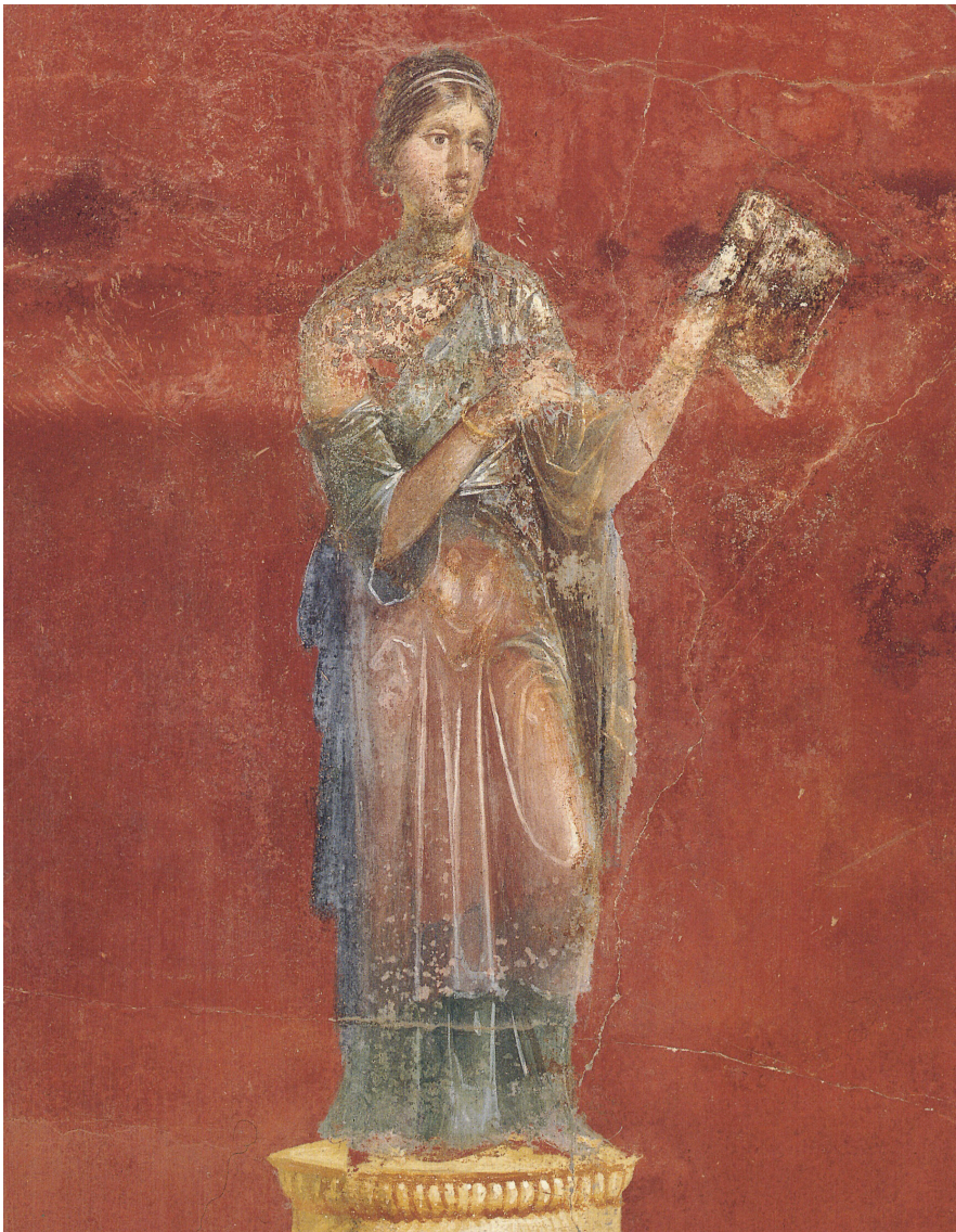
1.2. Clio, de Muze van de geschiedschrijving. Romeinse muurschildering uit het triclinium A van Moregine, 1ste eeuw n.Chr.

‘Dit is het verslag van het onderzoek (ιστορίας ἀποδέξις) van Herodotus van Halicarnassus, (gepubliceerd) met de bedoeling dat noch hetgeen gebeurd is (τὰ γενόμενα) door toedoen van mensen op de lange duur vergeten wordt, noch grote en bewonderenswaardige daden en werken (ἔργα μεγάλα τε καὶ θαυμαστά), deels door Grieken, deels door niet-Grieken verricht, roemloos worden, en in het bijzonder ook door welke oorzaak (αἰτίη) zij met elkaar in oorlog geraakten.’ (1.0)