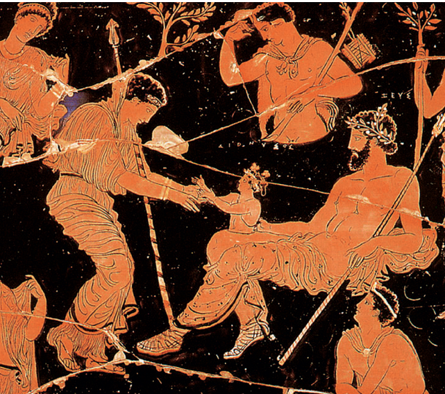
1.6. De geboorte van Dionysus uit de dij van Zeus. De baby strekt zijn handen uit naar Hera. Detail van een rood-figuurige vaasschildering uit ca. 410 v.Chr.

Het ongelukkige lot van de andere dochters, Semele en Agaue, is sterk verbonden met de geboorte en de cultus van Dionysus, de god die ook in het eerste en laatste koorlied van Antigone een rol speelt. Semele, de jongste dochter van Cadmus, had een verhouding met niemand minder dan de oppergod Zeus, van wie zij zwanger