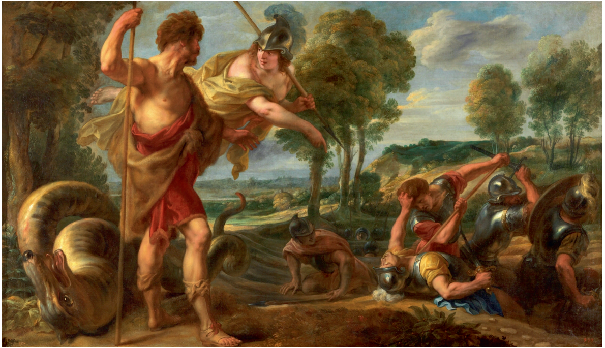
1.3. Cadmus krijgt van Athene advies de drakentanden uit te zaaien, waaruit de Spartoi geboren worden. Een schilderij van Jacob Jordaens (1593-1678), Prado Museum, Madrid.

elkaar bestreden tot er nog vijf over waren. Deze ‘Gezaaide Mannen’ of Spartoi sloten vrede met Cadmus, die daarna de stad Thebe stichtte. De Spartoi werden de stamvaders van de vijf voornaamste geslachten van Thebe. Cadmus zelf trouwde met Harmonia, de dochter van Ares en Aphrodite.