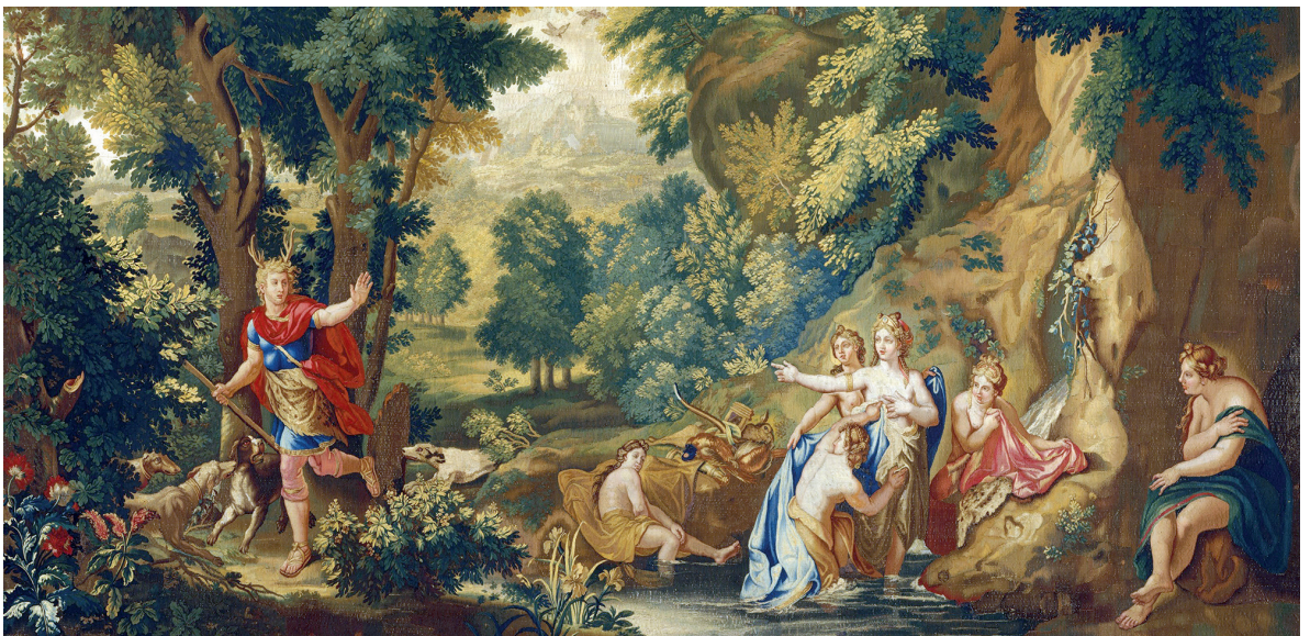
1.5. De metamorfose van de jager Actaeon als straf voor het feit dat hij Artemis naakt ziet baden. Frans wandtapijt uit ca. 1700.