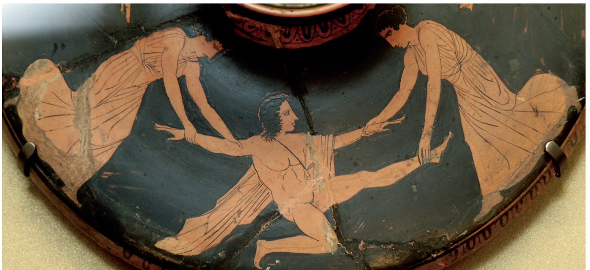
1.7. Pentheus wordt verscheurd door zijn moeder en tante. Roodfiguurige vaasschildering uit ca. 420 v.Chr.

De enige zoon van Cadmus en Harmonia, Polydorus, kreeg op zijn beurt weer een zoon die