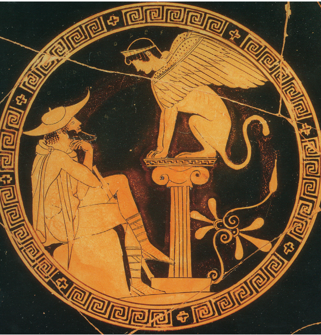
1.8. Oedipus lost het raadsel van de sfinx op. Roodfiguurige schildering op een drinkschaal uit Athene. Vaticaanse Musea.

Labdacus heette. Labdacus werd koning van Thebe na de dood van Pentheus (hoewel Pentheus ook een zoon had: Menoeceus, die de vader zou worden van Creon en Iocaste). Naar hem is de dynastie van de Labdaciden genoemd.