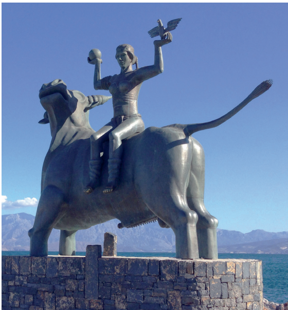
1.1. De Phoenicische prinses Europa wordt door Zeus in de gedaante van een stier ontvoerd naar Kreta. Bronzen beeld in Agios Nikolaos (Kreta) door Nikos Koundouros.

Cadmus gehoorzaamde en liep achter de koe aan tot ze stopte. Toen hij even wilde uitrusten, werd hij aangevallen door een draak. Cadmus sloeg de draak dood met zijn zwaard, en op advies van de godin Athene zaaide hij vervolgens de tanden van de draak in de grond. Niet veel later kwamen uit de grond krachtige soldaten tevoorschijn, die