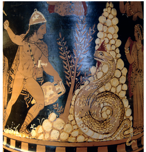
1.2. Bij de stichting van de stad Thebe doodde Cadmus de draak van Ares die de bron ter plaatse bewaakte. Rood-figurige krater uit Paestum (ca. 350-340 v. Chr.).