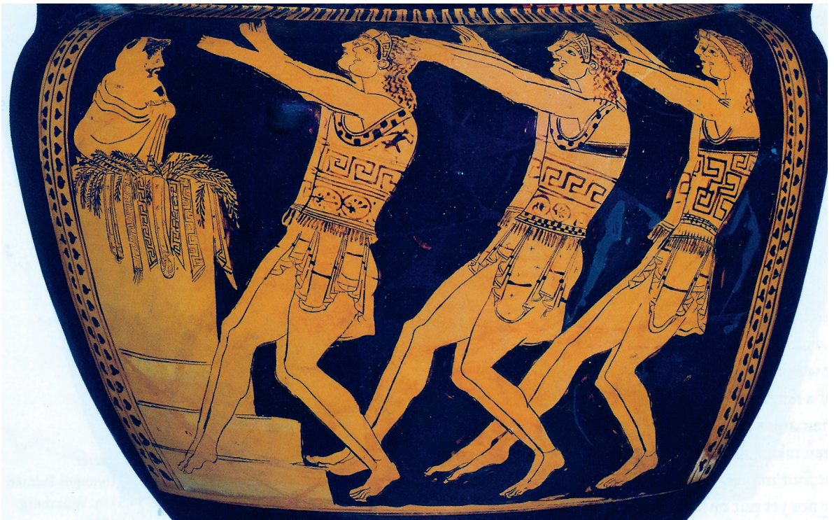
2.1. Vaasafbeelding met een dansend koor van jongemannen. Antikenmuseum, Basel.

Zo weten we bijvoorbeeld niet zeker of Thespis echt de uitvinder van de tragedie was; hij wordt wel in meerdere bronnen genoemd als de eerste prijswinnaar. Ook weten we niet waar de naam 'tragedie' vandaan komt. Het Griekse τραγῳδία betekent letterlijk 'bokkenlied', en dat heeft in de loop der tijd de meest uiteenlopende theorieën opgeleverd: sommigen denken dat een bok de