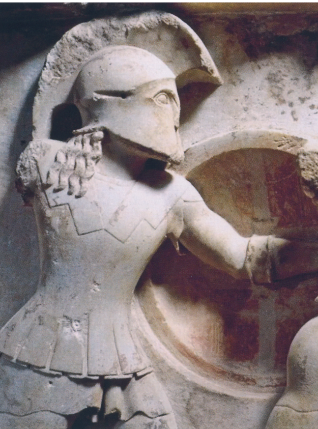
1.9. Aeneas vechtend onder de muur van Troje. Een reliëf van het Schathuis van Sifnos in Delphi, 6de eeuw v. Chr.

Met de Aeneis schiep Vergilius een epos waarin Romes ontstaan en groei tot wereldmacht, uitmondend in een door Augustus bewerkte vrede, worden voorgesteld als een door de goden en het Fatum beschikte vervulling. Evenals veel Romeinen was Vergilius dankbaar voor het feit dat er onder Augustus een einde was gekomen aan de burgeroorlogen die Rome een eeuw lang hadden geteisterd.