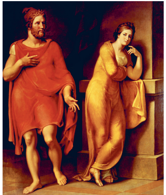
1.12. Odysseus en Nausikaä. Schilderij van Johann Heinrich Wilhelm Tischbein uit 1819.