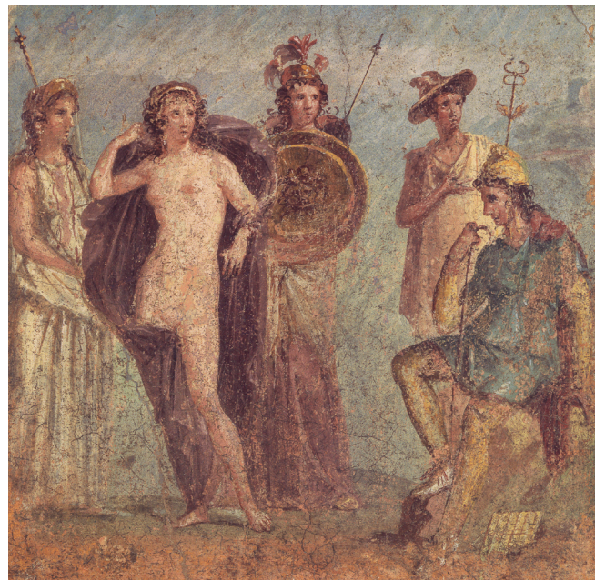
1.5. Het Parisoordeel. Romeinse muurschildering uit Pompeji.

In de Aeneis wordt verteld hoe Aeneas, zoon van de Trojaanse prins Anchises en de godin Venus, was voorbeschikt om aan de verwoesting van de stad Troje te ontsnappen en na vele omzwervingen en hevige strijd een nieuw vaderland te stichten voor de overlevenden van de Trojanen. Zijn missie