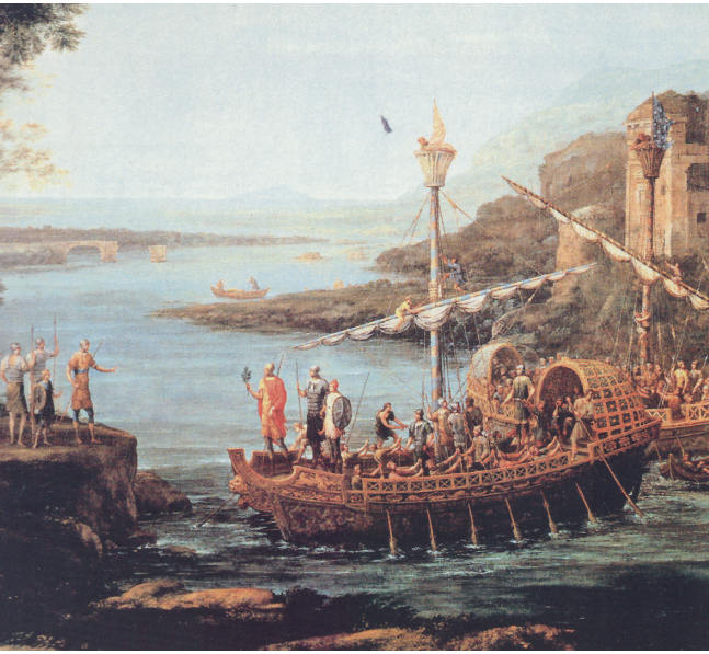
1.8. Aeneas komt aan in Latium. Schilderij van Claude Lorraine uit 1675.

Aeneas tot vrouw geven, ook al was ze aanvankelijk beloofd aan Turnus, koning van de Rutuliërs. Juno hitst Turnus op om de wapens op te nemen tegen de Trojanen. Latinus en zijn Latijnen kiezen de kant van Turnus. En zo brandt er een gruwelijke strijd los tussen enerzijds de Trojanen en anderzijds de Rutuliërs en de Latijnen.