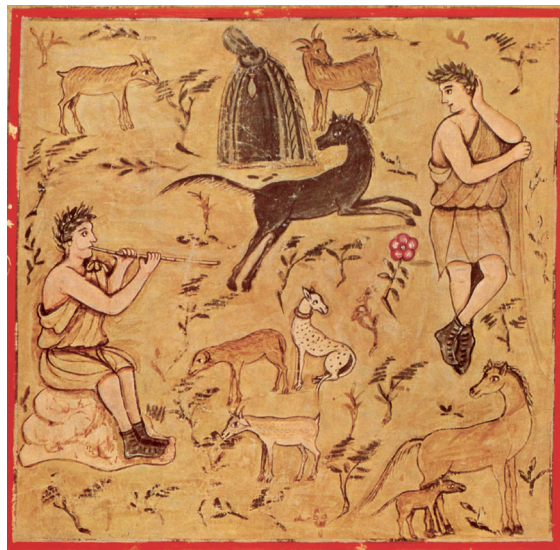
1.4. Twee herders met hun vee. Miniatuur bij het derde boek van Vergilius' Georgica in een 5de-eeuws handschrift.

een ander mag juist op zijn land blijven. Het laat zich aanzien dat Vergilius in deze gedichten zijn eigen ervaringen heeft verwerkt.