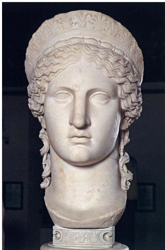
1.7. Juno, godin van het huwelijk. Een Romeinse kopie van een Grieks origineel.

In boek 7 vaart Aeneas de Tiber op en komt aan in Latium, het gebied van Latinus, koning van de stad Laurentum. Latinus ontvangt Aeneas en zijn makkers gastvrij. Hij wil zijn dochter Lavinia aan