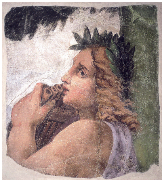
1.3. Vergilius met een panfluit. Fresco van Rinaldo Mantovano (Il Mantovano) uit ca. 1539.

Rond 39 v.Chr. publiceerde Vergilius de Bucolica , ook wel Eclogae , 'uitgezochte gedichten', genoemd. Het is een bundel van tien gedichten, waarin herders optreden die zingen over de liefde, de dood, over het aanbreken van een gouden tijd, over dichters en de poëzie. In deze ideale pastorale wereld, die ook wel Arcadia wordt genoemd, verschijnen ook goden zoals Pan, Apollo, Nimfen en de Muzen, die soms het woord nemen. In deze tijdloze wereld die eigenlijk alleen in de fantasie van de dichter bestaat, verweeft Vergilius ook veel verwijzingen naar de historische werkelijkheid. Zo hebben Ecloga 1 en 9 als thema de landverdeling. Een herder vertelt dat hij zijn land moet verlaten vanwege de onteigeningen na de burgeroorlogen,