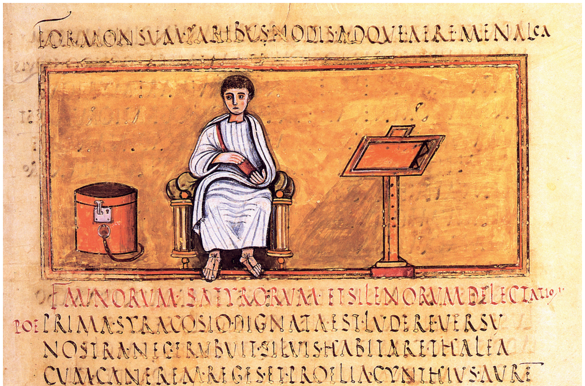
1.1. Vergilius. Illustratie in een Vergiliushandschrift uit ca. 400.

Aan het eind van de burgeroorlog die na de moord op Caesar in 44 v.Chr. was uitgebroken, kregen de soldaten die in deze oorlog hadden meegevochten een stukje land en een huis toegewezen. De nieuwe machthebber Octavianus Augustus zag het namelijk als een van zijn taken om de landbouw, die door de burgeroorlogen zo lang was verwaarloosd, weer tot bloei te brengen. Voor dit doel werd ook de boerderij van Vergilius' familie onteigend. Later kreeg de dichter zijn boerderij weer terug door bemiddeling van belangrijke vrienden, onder wie de in literatuur geïnteresseerde Pollio, gouverneur van dat gebied. Vergilius heeft dus de ont-