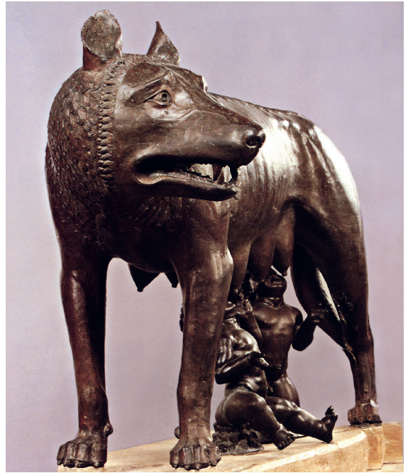
1.6. La Lupa Capitolina, het bronzen beeld van een wolvin en symbool van de stad Rome, werd tot voor kort als een Etruskisch meesterwerk uit de 5de eeuw v.Chr. beschouwd. De datering van de wolvin is onzeker. Sommigen menen dat de wolvin in de middeleeuwen is vervaardigd, anderen in de oudheid. De kindertjes Romulus en Remus zijn in de 15de eeuw eraan toegevoegd.

Het lot, het Fatum , had bepaald dat er in Italië een groot en machtig rijk zou verrijzen en dat dit rijk de voortzetting zou zijn van het door de Grieken verwoeste Troje. Romulus en Remus, nakomelingen van Aeneas, waren de legendarische stichters van Rome. Aeneas is op deze manier de stamvader geworden van de Romeinen. Vergilius sluit hierbij aan bij een oudere epische traditie. Nieuw is de verbinding die Vergilius legt tussen de mythe van de Trojaanse afstamming van de Romeinen – een mythe die we ook bij andere volkeren aantreffen zoals bij de Grieken – en de lokale mythe van de tweeling Romulus en Remus, die na te vondeling te zijn gelegd en door een wolvin te zijn gevoed, gered werden. Vergilius laat Romulus en Remus direct van Aeneas afstammen. Zo wordt de voorge-