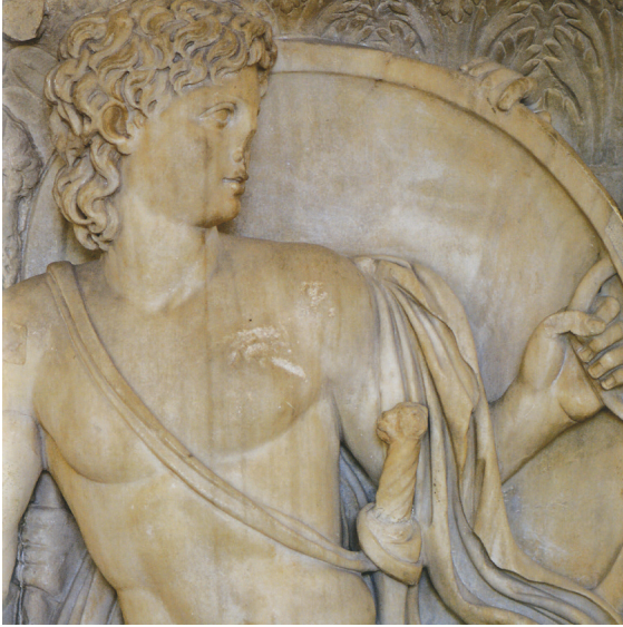
1.11. Achilles op een Attische sarcofaag uit ca. 240 n.Chr.

vast en sleurt hem zo naar het Griekse kamp. Patroclus wordt gecremeerd en om zijn woede te koelen sleurt Achilles het lijk van Hector dagelijks om de grafheuvel van zijn vriend heen. Dan verschijnt Priamus, de vader van Hector en koning van Troje, in het Griekse kamp om het lijk van zijn zoon terug te kopen. De Ilias eindigt met de begrafenis van Hector.