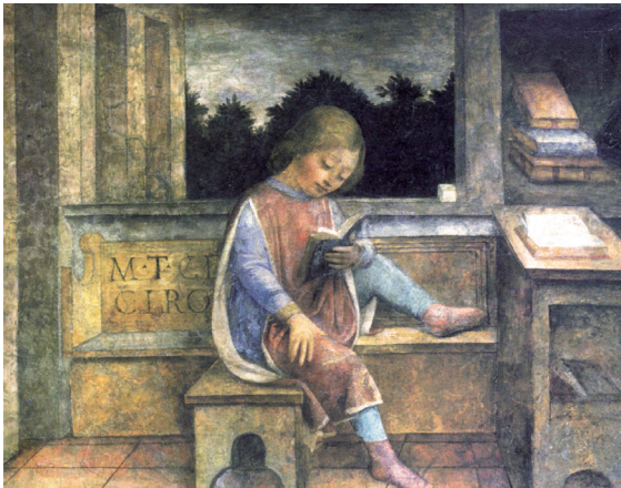
2.1. Cicero als brave schooljongen op een fresco van Vincenzo Foppa, 1463.