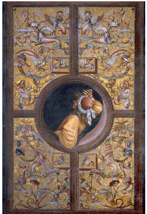
1.2. Fresco met Empedocles geschilderd door Luca Signorelli uit de Dom van Orvieto, 1500-1503.

Het is goed om in het achterhoofd te houden dat het Griekse woord φίλια een veel ruimere betekenis heeft dan ons woord vriendschap. Het kan ook betrekking hebben op affectie en (erotische) liefde. De term kan gebruikt worden voor verschillende vormen van relaties, waarbij sprake is van een sterke band. Het kan gaan om liefde en genegenheid tussen familieleden, om vriendschap tussen burgers en tussen mensen die zakelijk met elkaar verbonden zijn, en om de hechte band tussen kameraden en vrienden.