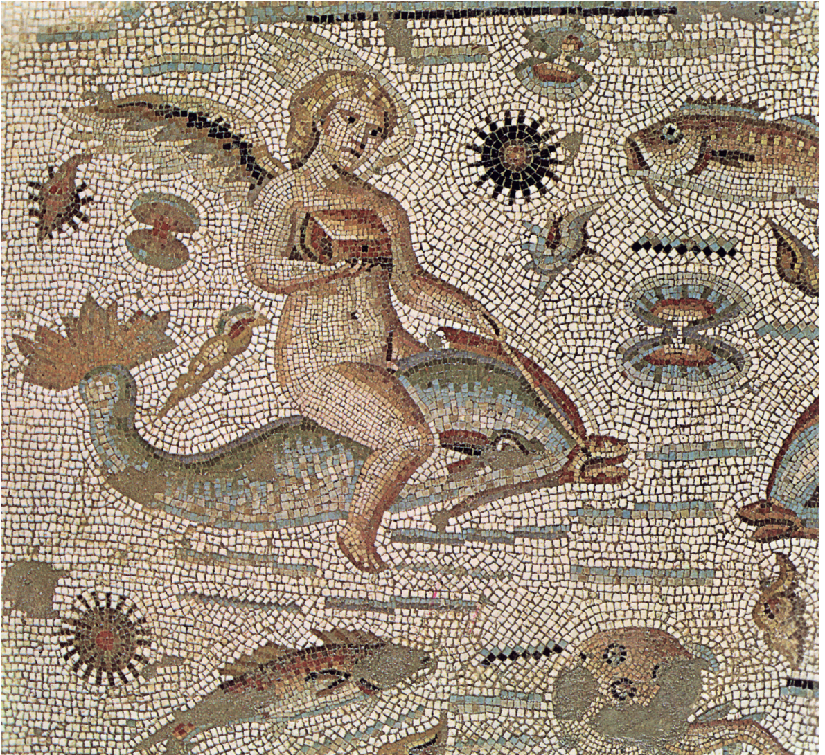
1.4. Romeins mozaïek met Eros op een dolfijn in Bulla Regia (Tunesië).

vrienden niet gelijk blijven aan wie ze waren. Want als zij niet langer meer aangenaam of nuttig voor elkaar zijn, verdwijnt de liefde die zij voor elkaar voelen. Het nuttige echter is niet iets bestendigs, maar kan van gelegenheid tot gelegenheid verschillen. Dus wanneer het motief waarop de vriendschap is gebaseerd, weggevallen is, wordt ook de vriendschap ontbonden, aangezien zij met het oog hierop was gesloten. 4 Vooral bij oude mensen schijnt zo'n vriendschap voor te komen (mensen van die leeftijd zijn namelijk niet uit op