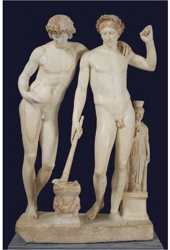
1.5. Twee jongemannen, lang geïdentificeerd als Orestes en Pylades, eerste eeuw n.Chr.

7 Het ligt in de rede dat zo'n vriendschap bestendig is. Want hierin komen alle eigenschappen samen die vrienden moeten hebben. Elke vriendschap namelijk heeft een goed of genot als motief, hetzij zonder meer, hetzij gerelateerd aan degene die de vriendschapsgevoelens heeft; en aan elke vriendschap ligt een zekere gelijkheid tussen