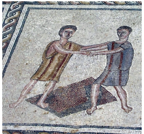
1.3. Twee vrienden op een mozaïek uit het Huis van Orpheus in Sepphoris (Israël), derde eeuw n.Chr.

hem goed dunkt. Maar dit zal geen enkel verschil maken, want dan stellen we dat wat hij goed vindt, gelijk aan wat voorwerp van liefde schijnt te zijn.