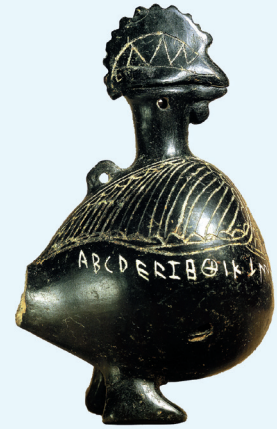
27. Inktpotje in de vorm van een haantje uit de 7de eeuw v.Chr. met van links naar rechts het alfabet.

αι aj ει ei (oorspronkelijk uitgesproken als in 'zee') οι oj αυ au ευ ui (oorspr. als in 'eeuw') ου oe (oorspr. als in 'doos')