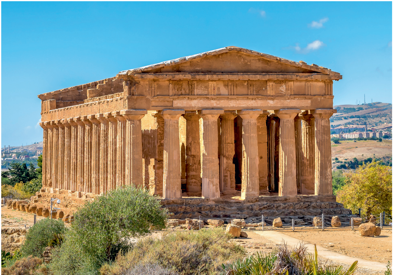
1. Een Griekse tempel