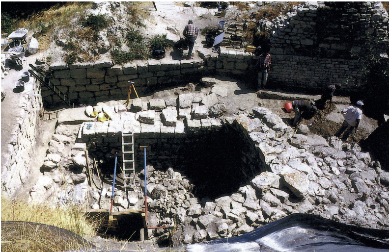
20. Opgravingen in Troje.

In de twintigste eeuw heeft zich nog een nieuwe, heel belangrijke tak van deze wetenschap ontwikkeld: de onderwaterarcheologie. Diepzee-duikers, aanvankelijk uitsluitend amateurs, hebben sinds 1900 de