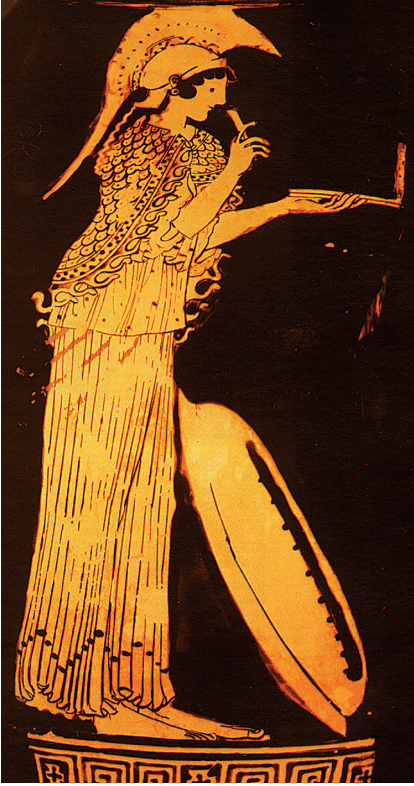
24. De godin Athena schrijft op een wastafeltje. Een Griekse vaasschildering.

ingekrast. De was kon men weer gladstrijken en zo konden de plankjes steeds opnieuw worden gebruikt. Ook potten die kapot waren, werden niet zomaar weggegooid, maar de scherven dienden als schrijfmateriaal!