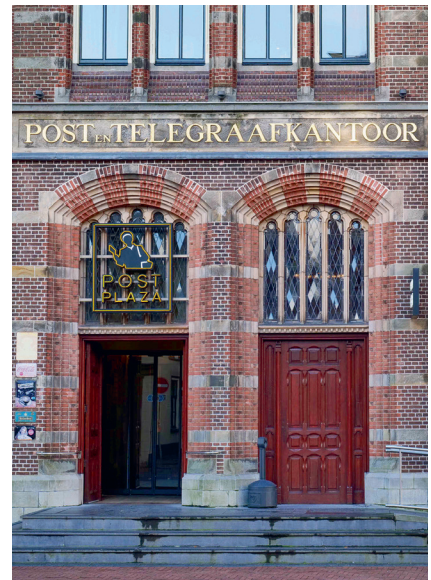
14. 'Telegraaf' is afgeleid van tèlè = ver en graphein = schrijven. Telegraaf is een toestel om in korte tijd berichten over langere afstand over te brengen.