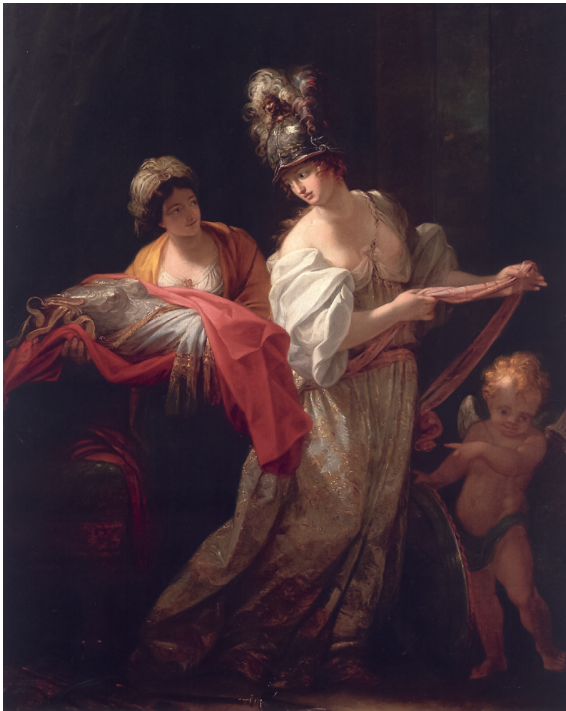
9. De godin Pallas Athena bewapent zich om de strijd in te gaan. Een schilderij van Angelica Kauffmann uit ca. 1768.

Waar kom je de Grieken nog meer tegen in onze cultuur? Er zijn natuurlijk de archeologische musea, die overblijfselen uit de Griekse oudheid, zoals beelden en aardewerk, ten toon stellen. Maar ook andere musea bevatten kunstvoorwerpen die te maken hebben met de Griekse oudheid. Hoe kan dat? De Grieken vertelden heel graag verhalen. Deze verhalen, mythen genaamd, hadden vooral betrekking op goden en helden en zijn zó fascinerend dat ze niet alleen de Grieken hebben geboeid, maar ook de mensen uit latere perioden. Zo werden kunstenaars vooral vanaf de vijftiende eeuw erdoor geïnspireerd en beeldden ze uit op hun schilderijen of met hun beelden. Ook dichters en schrijvers vonden vaak hun inspiratie in deze oude Griekse verhalen. Je moet dus iets afweten van de Griekse mythen, als je de kunst uit bepaalde perioden van de Europese cultuur wilt begrijpen.