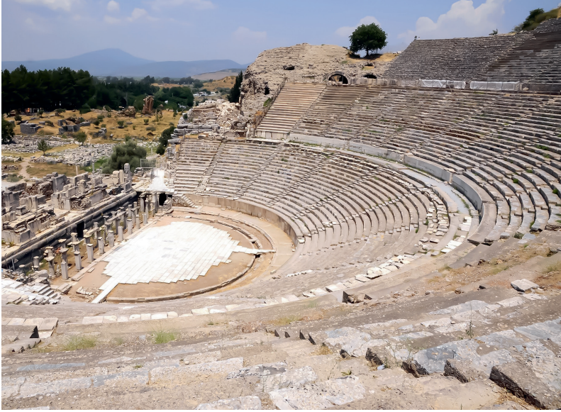
4. Een Grieks theater.

de wetten van zijn land gehoorzamen? Is een mens schuldig aan daden die hij zonder het te weten heeft begaan? De manier waarop de Griekse toneelstukken deze vragen behandelen, maakt ze nog steeds actueel.