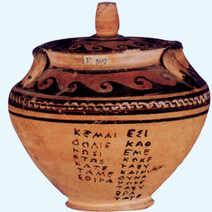
28. Een Griekse pot van aardewerk met een schrijfoefening uit de 4de eeuw v.Chr.