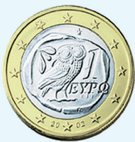
26. De Griekse euro met de uil van Athena.