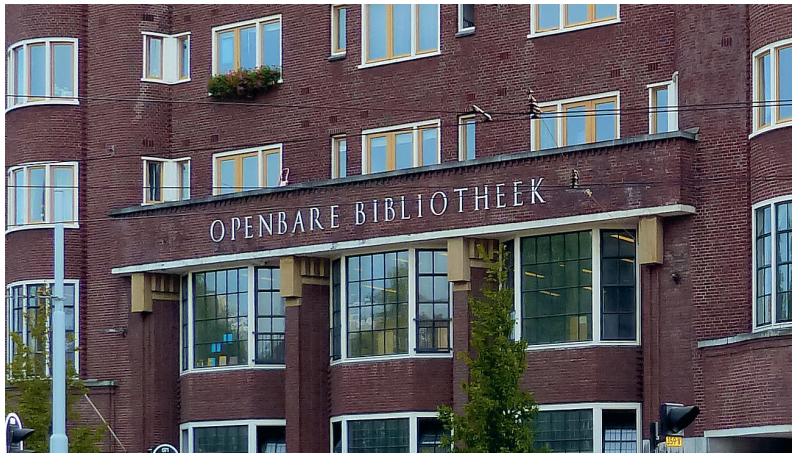
12. 'Bibliotheek' is afgeleid van biblion = boek en thèkè = bewaarplaats.

De Nederlandse taal kent veel woorden die teruggaan op het Oudgrieks. Dit zijn soms moeilijke woorden die gebruikt worden door artsen, advocaten of natuurkundigen. Maar ook heel gewone woorden die iedereen dagelijks gebruikt, zijn van oorsprong Grieks, zoals: probleem, programma, politie, idee, karakter, meter, basis, school, energie, dialect, idioot, gymnastiek, lamp, muziek, planeet. In iedere Nederlandse stad waar je doorheen loopt, zul je woorden en namen aantreffen die op de Griekse taal of cultuur teruggaan. Hieronder zie je foto's van enkele voorbeelden.