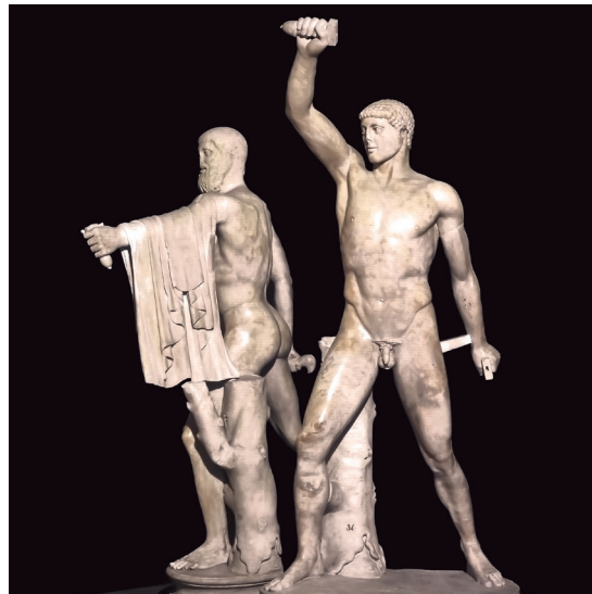
10. De tirannendoders. Deze beelden-groep was in het klassieke Athene het symbool van de democratie: twee strijdende mannen die ervoor gezorgd hadden dat het Atheense volk ontkomen was aan het juk van de tirannie en vrij leefde in een democratie. Een Romeinse kopie van een Grieks beeld.

Leerlingen hebben weinig inspraak op school. De schoolleiding en de docenten zijn de baas. Dat klinkt niet zo 'democratisch'. Toch is Nederland wel degelijk een democratisch land. Hiermee bedoelen we dat het volk ('dèmos' in het Grieks) de macht ('kratos' in het Grieks) in handen heeft. Sommige Griekse steden hadden al een democratische bestuursvorm. Je zou zelfs kunnen zeggen dat zij de democratie hebben uitgevonden. Nu zijn er wel grote verschillen tussen de Griekse vorm van democratie en die van ons. In de stad Athene konden alle mannelijke burgers deelnemen aan de vergaderingen waar de belangrijke politieke besluiten werden genomen. Bij ons hebben de meeste mensen niet rechtstreeks deel aan het bestuur; wij kiezen afgevaardigden die voor ons het land besturen. Een belangrijke overeenkomst is wel de vrije meningsuiting die als een grondrecht van onze democratie geldt en ook bij de Grieken hoog in het vaandel stond.