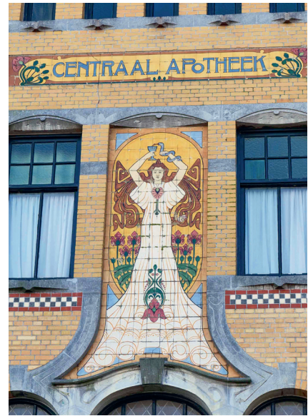
11. Het woord 'apotheek' is afgeleid van het Griekse woord apothèkè = bewaarplaats.