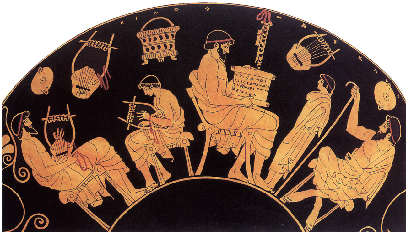
22. Een Griekse schoolsituatie. Er wordt lesgegeven in het bespelen van de lier en het voordragen en schrijven van gedichten. Rechts zit de paidagogos, de slaaf die de jongen naar school heeft gebracht. Op de papyrusrol die de leraar ophoudt staat de dichtregel geschreven: 'Muze aan mij ik begin te zingen over de wijdstromende Skamander'. In het Grieks loopt de zin niet correct. Waarschijnlijk is de dichtregel door de jongen gemaakt en bespreekt de leraar de fouten. Een roodfigurige vaasschildering.