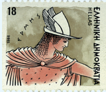
25. Griekse postzegel. De Grieken noemen hun land nog steeds Hellas.

Wanneer je zegt ‘ik snap er geen iota van’, om aan te geven dat je geen snars van iets begrijpt, heb je de naam van een Griekse letter gebruikt, de iota. Ook een andere Griekse letter ben je misschien vaker tegengekomen: de delta, de Griekse d. Denk maar eens aan de deltawerken. Het woord alfabet zelf bestaat uit twee namen van Griekse letters, de alfa en de bèta, maar ons alfabet is toch heel anders dan het Griekse ‘Alfa Bèta’!