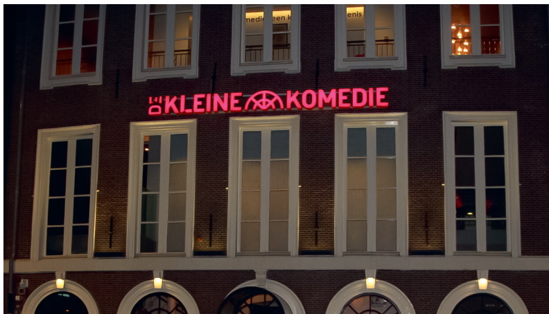
13. 'Komedie' is afgeleid van komooidia = blijspel.