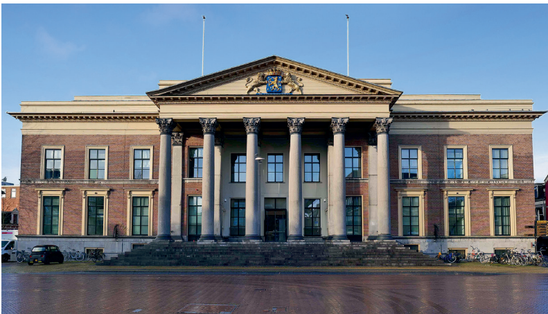
6. Het gerechtsgebouw in Leeuwarden. De voorgevel vertoont kenmerken van een Griekse tempel.