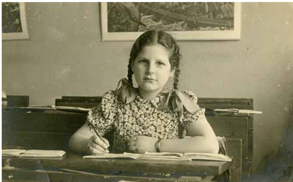
Nanny als elfjarige.

We kwamen bij een gezin met twee grotere jongens terecht. De oudste jongen in dat gezin, zeventien zal hij ongeveer geweest zijn, nam mij op een keer mee naar het zwembad in Arnhem. Daar was ik nooit eerder geweest en ik kon helemaal niet zwemmen. Ik vond het doodeng. Maar ik zei niets, in de hoop dat het allemaal goed af zou lopen. Op de fiets was ik al heel bang, maar in dat zwembad helemaal. Ze zullen me wel pootje hebben laten baden, ik weet het niet meer. Daarna zijn we nog een paar keer naar dat zwembad gegaan. De jongere broer, van vijftien of zo, ging toen ook mee. Die vader heb ik nooit gezien, die moeder heel af en toe.'