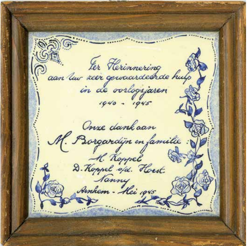
Bedanktegeltje van Nanny's ouders voor het eerste onderduikadres.

verhaal is zo pijnlijk voor haar en wordt nog pijnlijker.'