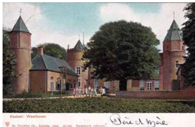
Ansichtkaart van Kasteel Westhove te Zeeland met op de voorgrond de oude linde, rond 1902 (uitgave Dr. Trenkler Co., Leipzig).

van Beilen, wat een mooie boom is dat, is afgefallen. Idem voor de hunebedeiken, die zo vaak afgebeeld staan op foto's en ansichtkaarten. De schattige etagelinde, alias rondkopboom, van Borger is evenmin opgenomen. Misschien moet er toch maar een deel 2 komen, en dan over de beroemde bomen van het Noorden.