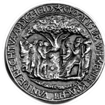
Sluitpenning ambtsketen van de burgemeester van Oosterhout door Niel Steenbergen (1989). Stedelijk Museum Breda.

600 jaar. Deze staat op rijke grond die je langs grote rivieren vindt, in tegenstelling tot de zandgrond waarmee de Heilige Eik het moet doen. Wat mij betreft blijft de leeftijd van de Houtse eik een mysterie, maar hij ligt eerder tussen de 600 tot 800 jaar dan rond de 300. Beroemd is hij zeker. Er is vrijwel geen boom in Nederland te vinden waarvan de adelbrieven zo ver teruggaan. Topografische kaarten uit de voorgaande eeuwen vermelden de eik constant en naar het schijnt heeft half Den Hout een schilderij van hun boom aan de wand. Erg fotogeniek is de boom overigens niet. Dat is wellicht de reden dat hij nauwelijks op ansichtkaarten staat. Dat mag de pret niet drukken. De eik is de trotse bezitter van een eigen animatiefilm en het pièce de résistance is de sluitpenning in de ambtsketen van de burgemeester van Oosterhout. Hierop staat vermeld: 'het Gerecht van Den Hout, onder de Heilige Eik'. 'Daar werd eertijds rechtgesproken,' aldus de uitleg van Niel Steenbergen (1911-1997), de Oosterhouter medailleur en maker van de penning.