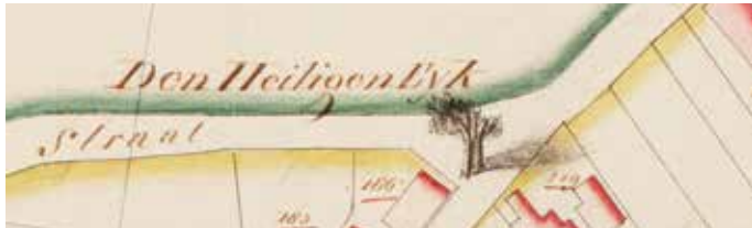
Uitsnede kadastrale kaart, Minuutplan Oosterhout 1821, sectie P, 01.

de helft nog overeind stond maar waarvan de oude kroon volledig verdwenen was.