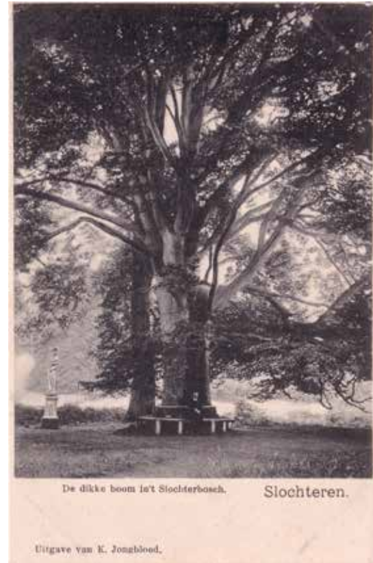
Ansichtkaart van de Dikke of kindertjesboom van Slochteren, rond 1902 (uitgave K. Jongbloed).

een postzegel of een munt. En niet te vergeten een eigen naam. In de botanische wereld is dat een zeldzaamheid en dus een pre om opgenomen te worden in de lijst der groten van Nederland. Voor al deze onderdelen kon een boom 'boekpunten' verdienen.