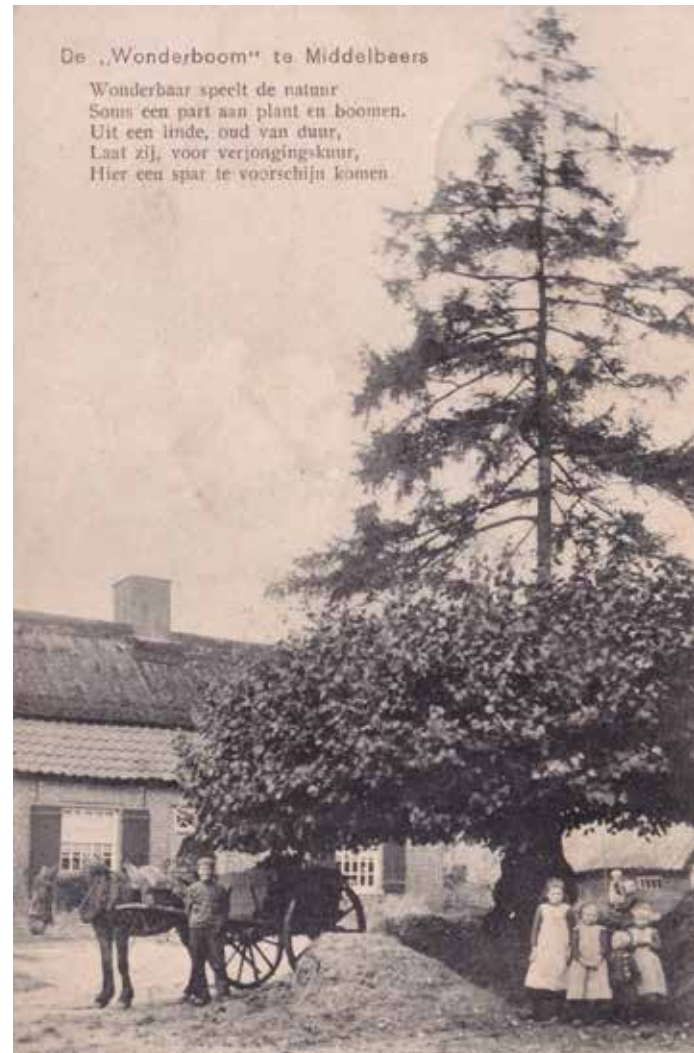
Ansichtkaart van de Wonderboom van Middelbeers (foto: J. Bijnen, uitgave P.J. De Graaf, Middelbeers).

In het verleden zijn al behoorlijk wat boeken verschenen over de monumentale bomen van ons land. Stuk voor stuk prima uitgaven. En toch mist er iets. De beschrijvingen van deze bomen zijn vaak kort. Wezens die al eeuwenlang een plek domineren, verdienen meer dan een plaatje en een kort verhaal. Dat is niet de eer die deze giganten toekomt.