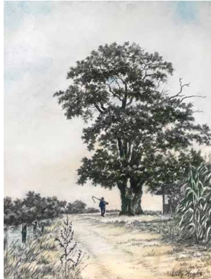
Krijttekening van de Kroezeboom rond 1970 door Willy Krake.

Met de klok mee volgt Zuid-Holland. Misschien wel de grootste verrassing is het bomeneldorado van de Hortus botanicus Leiden. Haast bij toeval kwam ik hier terecht en ik werd gegrepen door de vele bomen in deze oudste Hortus van ons land. De treurbeuk in het midden van de botanische tuin is een juweel. Het wel en wee van deze treurende boom wordt al gevolgd sinds hij net werd geplant. Ik ben blij dat ik deze boom heb gevonden. Veruit de bekendste boom van Noord-Holland was de Holle Boom bij Kraantje Lek. Volgens een volksverhaal haalden Haarlemse moeders hier hun kinderen vandaan. Hij is beschreven, bejubeld, geschilderd, bezongen, gefotografeerd, beklommen en uiteindelijk vereeuwigd in brons, een unicum!