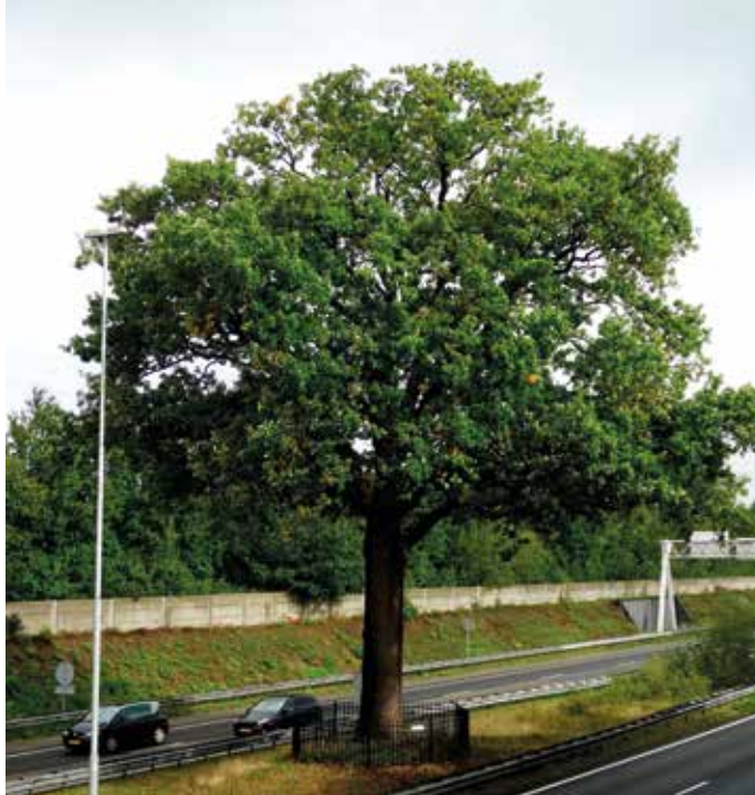
De Troetelek van Ulvenhout op de rijbaanscheiding van de A58, zomer 2020.

Er zijn meer criteria. Er moet toch eigenlijk wel een ansichtkaart zijn van de boom, liever nog: vele. Koplopers zijn waarschijnlijk de Wodanseiken van Wolfheze met meer dan honderd ansichtkaarten. Dat is niet het enige criterium. Er zijn niet veel bomen bezongen, geschilderd of gevat in rijmdichten of andere poëzie. En wat te denken van de verbintenis met een historische gebeurtenis, een eigen straatnaam of een boom die afgebeeld staat op