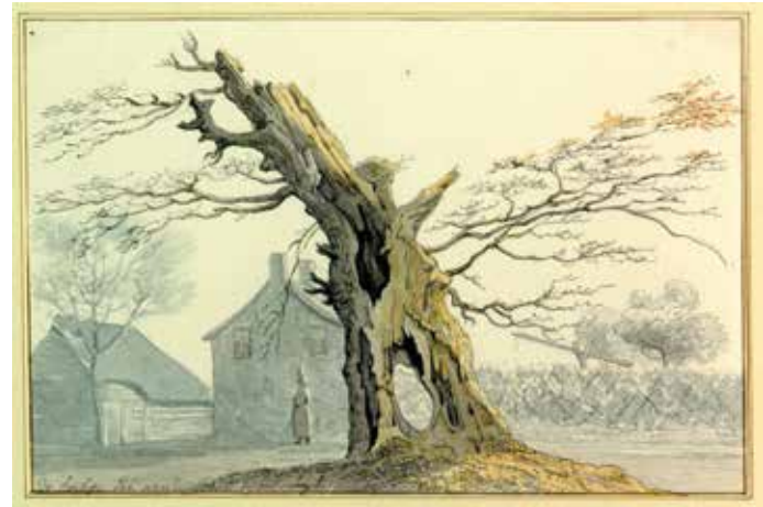
De Heilige Eikenboom in het gehucht Den Hout nabij Oosterhout, 1832. 'Die Eik is van hoogen ouderdom, en als punt van limiet scheiding reeds in oude oirconden overbekend.' Tekenaar: Daniël Gevers van Endegeest (collectie Atlas Van Stolk, Rotterdam).

groten (kroonreductie). Soms wordt de kroon 'afgestoten' door storm of bliksem. Heden ten dage is de boom kleiner dan op de oude prent. Er lijkt nog maar een derde van de stam over te zijn ten opzichte van de eik in volle glorie. Het toeval wil dat ook dit een mechanisme kan zijn om te overleven. Een oude boom verdeelt zichzelf in verschillende functionele eenheden. Valt er een deel uit, dan heeft een ander deel nog kans om te overleven. Ten slotte een laatste troef voor de theorie van de veterane boom. Eiken doorlopen een cyclus van ongeveer 300 jaar groei, 300 jaar consolidatie, en nog eens 300 tot 400 jaar voor de overgang naar en de voorbereiding op het uiteindelijke sterven na negen tot tien eeuwen.