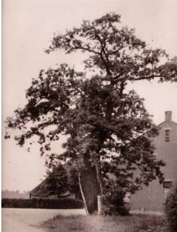
Prentbriefkaart van de Heilige Eik, omstreeks 1956.

Misschien is de wens de vader van de gedachte en is deze theorie te optimistisch? Daarentegen is er ook geen sluitend bewijs voor de theorie van de voorganger. Kenners dichtten de eik van Doornenburg een leeftijd toe van maximaal