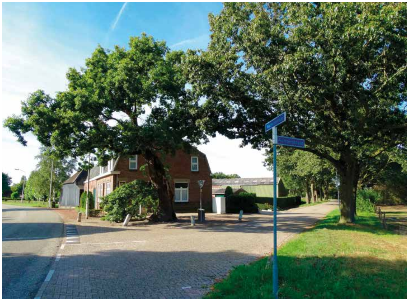
De Heilige Eik in de zomer van 2020.