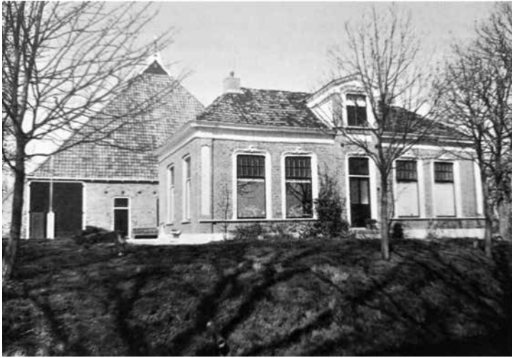
Andla State aan de Dongjumerweg in Ried, aan de westkant van het dorp.