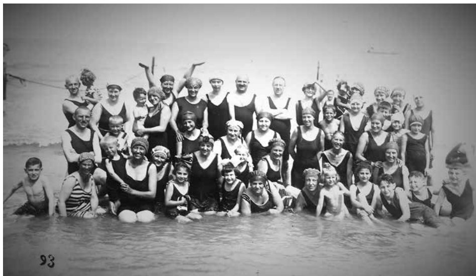
1924, de Birnbaums in Arendsee met vakantie

In 1930, na het uitbreken van de economische wereldcrisis van 1929, verliest de Duitse munt veel van zijn waarde, het werkloosheidspercentage is hoog en stijgt met de dag. In september 1930 worden er verkiezingen gehouden. De NSDAP van Adolf Hitler wordt de op een na grootste partij in Duitsland, na de socialisten en voor de communisten. De grote tijd van de nazipartij begint. De verkiezingen van november 1932 zijn de laatste democratische verkiezingen in Duitsland en in januari wordt Hitler rijkskanselier. Binnen één jaar vormt hij Duitsland om tot een nationaalsocialistische, totalitaire staat. Tegenstanders worden opgepakt, politieke partijen verboden, de hele maatschappij wordt grondig genazificeerd. Het economisch herstel en het nieuwe nationaal bewustzijn zorgen voor grote steun onder de bevolking.