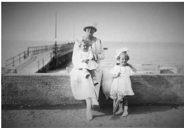
Vakantie in Binz in 1925, iedereen in het wit gekleed, zoals het hoort op vakantie aan zee