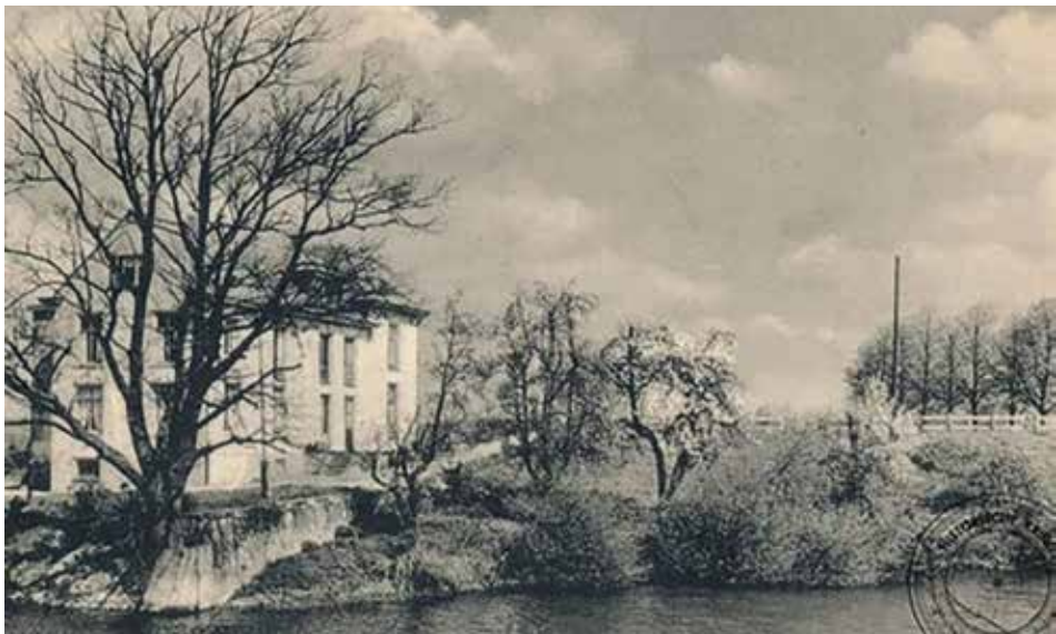
Huize Voorburg in Elden in 1930