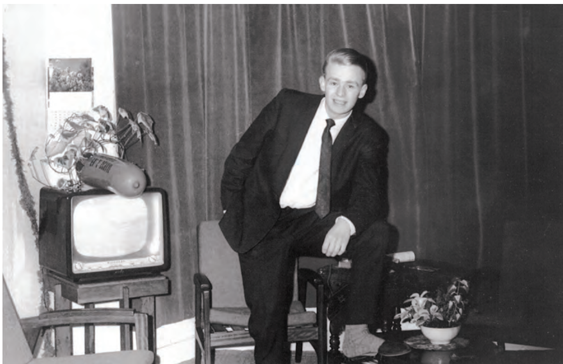
Verjaardag 19 maart 1966.

Na alles even ongestoord te hebben kunnen bekijken, ben ik weer vertrokken. Dit was niet wat ik had verwacht. Ik vond het wel stoer van mezelf dat ik ze onbevangen en open tegemoet durfde te treden. Stilletjes had ik gehoopt die jongens te treffen terwijl ze muziek maakten. Misschien had ik ze kunnen strikken voor een optreden.