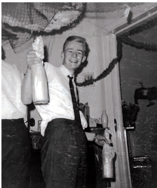
Verjaardag 19 maart 1966.

Die ontwikkeling kreeg in velerlei gedaanten in mijn latere leven opnieuw gestalte. Het was een tijd van experimenteren en ontdekkingen doen, ook op liefdesgebied, en er werd onbekommerd gedanst en muziek en plezier gemaakt. De tijd van Kuifje staat voor mij symbool voor de ontdekking van mijn eigen identiteit. Ik kwam erachter waar ik goed in was en waar mijn hart lag. Dat gold niet alleen voor mij; voor velen stond de periode van Kuifje symbool voor de ontdekking van hun eigen identiteit. In de stroom van destijds volgde je je eigen weg en probeerde je te ontdekken waar je kracht lag, desnoods tegen de verdrukking in. Een bevlogen en onnavolgbare periode vol positieve energie, passie en bezieling!