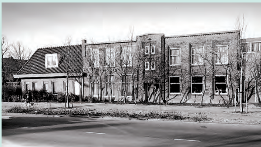
Sinneljocht, gelegen in de Bloemenbuurt.