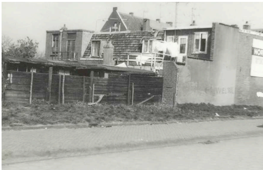
De achterkant van het rijtje huizen aan de Rijksstraatweg 283-289

De rust was weergekeerd op het moment dat de wedstrijd begon. Een benepen schril geluid van een rolfluitje klonk af en toe over de Orionweg en Jan Gijzenkade tot ver over de drukke Rijksstraatweg. Plotseling verbrak een oorverdovend geluid uit duizenden kelen de zondagsstilte in Haarlem-Noord, HFC Haarlem had gescoord! Dat gebeurde enkele keren. Na afloop van de wedstrijd kon iedereen zonder noemenswaardige controle uit de chaos van gestalde fietsen zijn voertuig pakken, met uitzondering van de dure motorfietsen die in de achtertuin door de benedenbewoners bewaakt werden. Het geld voor de stalling was binnen.