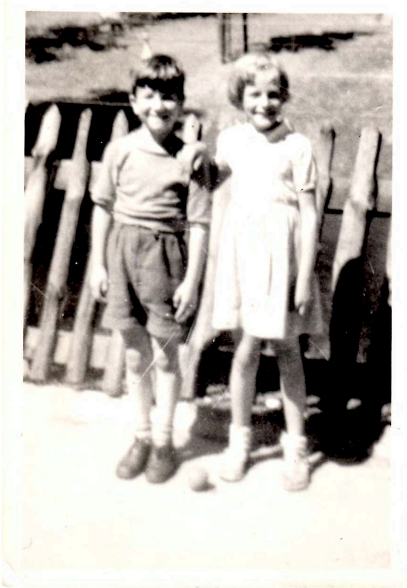
Met tennisbal en een onbekend meisje Haarlemmer Hout zomer 1951