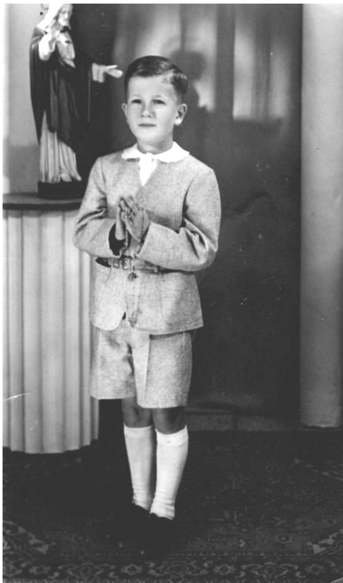
Mijn eerste heilige communie met kanten meisjeskraag, juni 1952