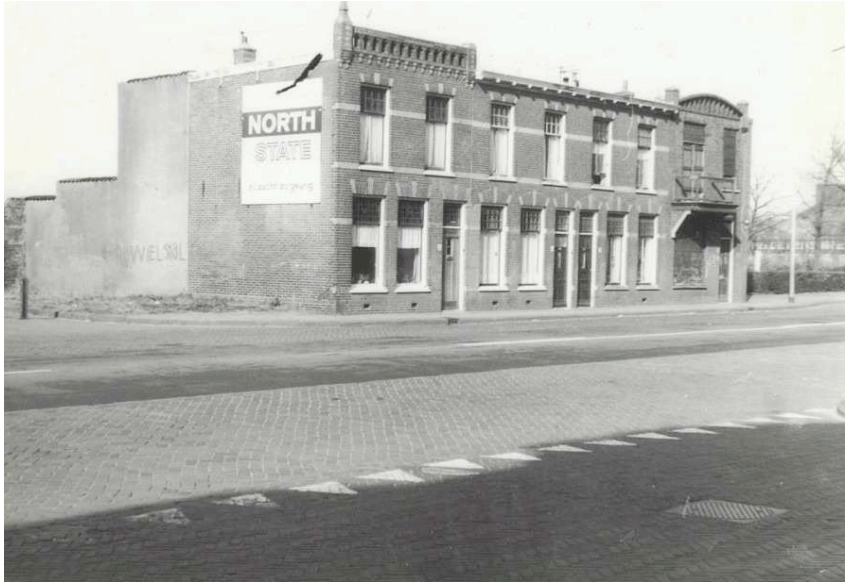
Het rijtje huizen aan de Rijksstraatweg 283-289