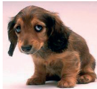
Afbeelding 1, Weekmaker

Dit bewijst dat de keuze voor hond X of Y meer op impuls en emotioneel genomen wordt dan rationeel. Het schoonheidsideaal 'mooi', leuk, lief, schattig is kennelijk belangrijk bij die keuze. Merkwaardig toch omdat een hond duidelijk meer is dan een buitenkant. Er wordt nauwelijks en te weinig kritisch gekeken naar de afstamming, erfelijke ziekten, leefomstandigheden als pup, socialisatie en werkeigenschappen.