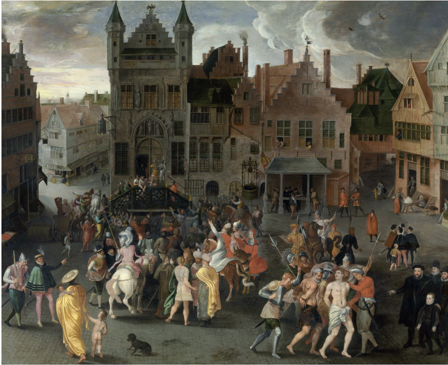
Afbeelding 3. Schilderij van het oude Gotische schepenhuis besteld door het stadsbestuur van Antwerpen vlak voor de afbraak. 'Een passiespel op de Grote Markt van Antwerpen' door Gillis Mostaert, ca. 1564 ( www.artinlanders.be )

ambachtslieden, 3 waardoor het inwonersaantal pijlsnel toenam van tussen de 10.000 en 20.000 in 1400, naar meer dan 33.000 in 1480 tot ongeveer 100.000 in 1570. Daarmee werd Antwerpen één van de grootste steden ten noorden van de Alpen. 4 De vervanging van het oude gotische schepenhuis door het nieuwe stadhuis is tot vandaag een tastbare getuige van deze transitie. Het nieuwe stadhuis, dat in een recordtijd van vier jaar werd gebouwd, moest niet alleen het politieke en economisch belang van de stad weerspiegelen, maar ook dat van de mannen die haar bestuurden.