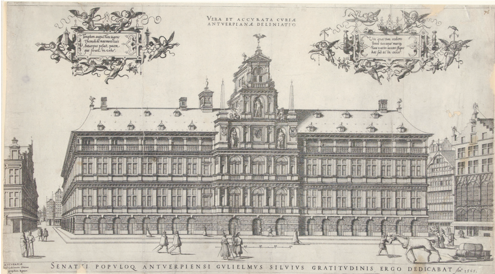
Afbeelding 2. Stadhuis van Antwerpen door Cornelis de Hooghe, 1565 (Rijksmuseum Amsterdam)

handelsnaties zowel in 1485 als in 1488 om hun vestiging te verhuizen van Brugge naar Antwerpen, een stad die hem wel trouw was gebleven. Toen de rust in 1492 uiteindelijk terugkeerde, bleven veel handelsnaties in Antwerpen en de Antwerpse jaarmarkten begonnen die van Bergen op Zoom te overschaduwden. Tegen 1530 was Antwerpen getransformeerd van een jaarmarktstad in een permanente markt en het belangrijkste handelscentrum in Noordwest-Europa. 2