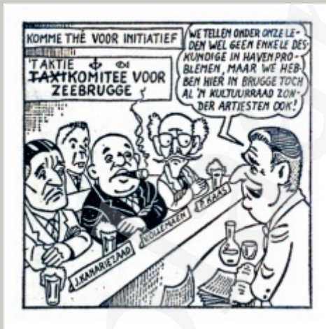
Deze cartoon van mijn neef Guido De Cloedt verscheen in Het Brugsch Handelsblad in 1960.