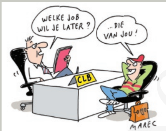
28 maart 2007