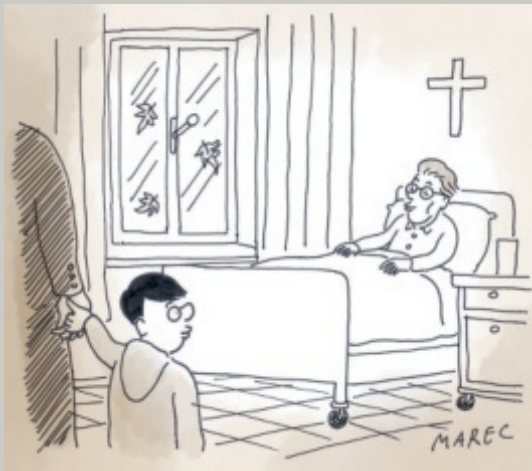
Mijn vader en ik op bezoek bij mijn neef Guido in het ziekenhuis in 1960.