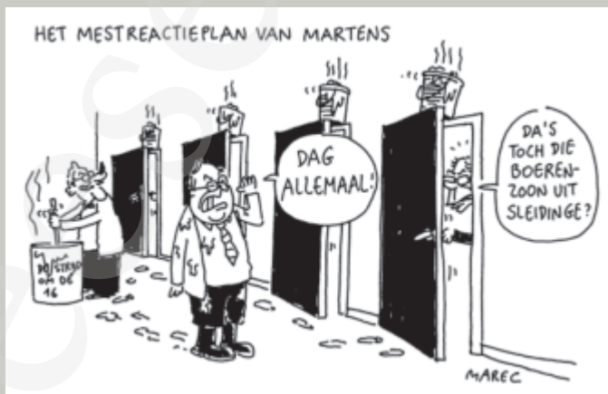
14 september 1993. Door deze tekening vroeg Dag Allemaal! of ik ook voor hen cartoons wilde tekenen.