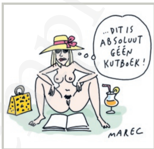
De tekening na correctie door Goedele.