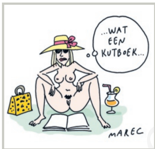
De tekening die ik indiende voor Het vaginaboek .

Plantu is een goede vriend geworden en ik maak nog altijd deel uit van Cartooning for Peace, een organisatie die hij samen met Kofi Annan oprichtte ter bescherming van cartoonisten wereldwijd.