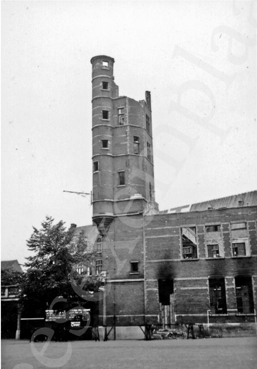
■ De Sint-Michielstoren van het Klein Seminarie brandt kort voor de bezetting van de stad helemaal uit