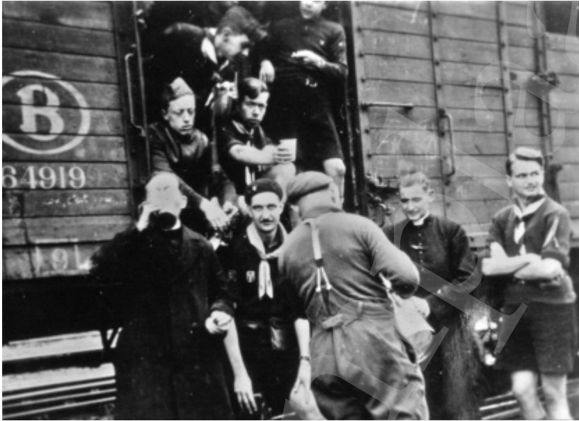
■ Mechelse scoutsjongens op weg naar Frankrijk, om zich daar bij de Belgische strijdkrachten te voegen

de groepen voetgangers die zich een weg baanden naar het aangegeven verzamelpunt. En altijd was er de angst voor die formidabele en onverwachte opmars van Duitse troepen. Overvlogen door Duitse bommenwerpers, beschoten met machinegeweren, gebombardeerd op de weg, of zelfs van de weg gereden door vijandelijke gemotoriseerde colonnes, stierven velen van hen, vrienden en broeders achterlatend. 70