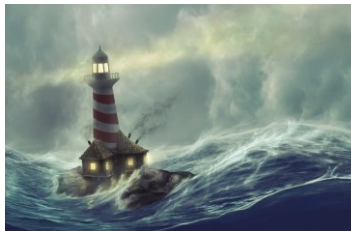
"The Lighthouse" Halmar Wåhlin, 2012