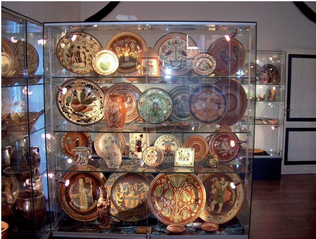
Vitrine met wandborden 1726.