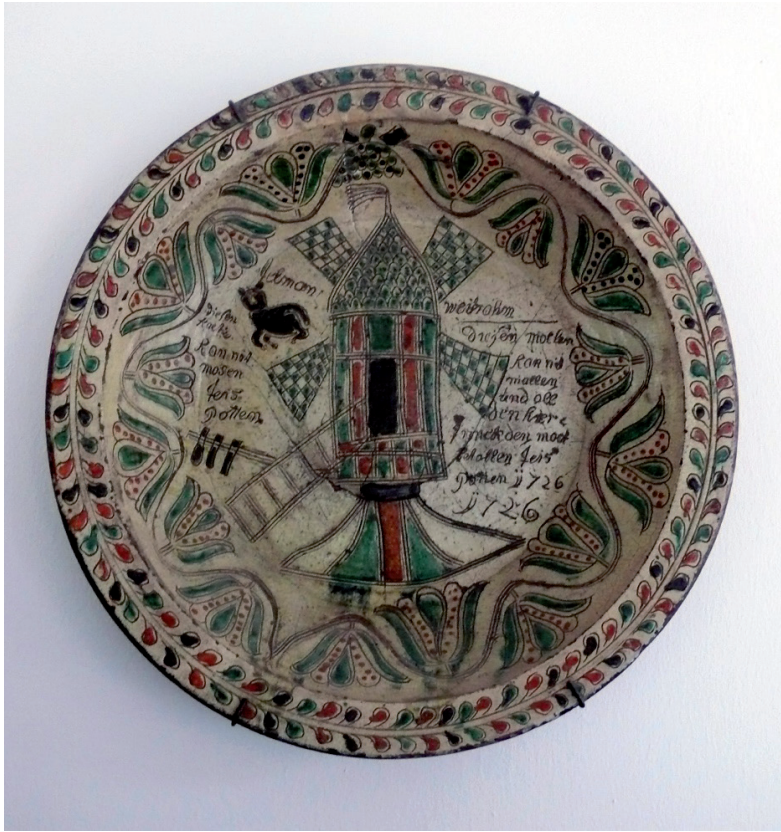
Wandbord Thijs Potten 1726