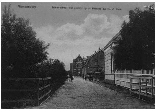
Te Numansdorp de pastorie van de Gereformeerde Kerk.

Na zijn studie Theologie nam hij het beroep aan naar Numansdorp. Daar nam hij de herdersstaf op in 1903. Totaal zou hij deze gemeente vier jaar dienen.