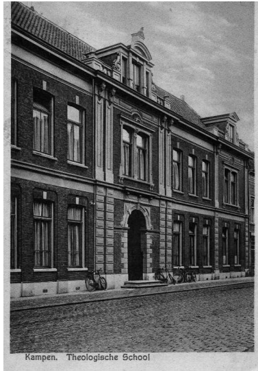
Kampen. Theologische School