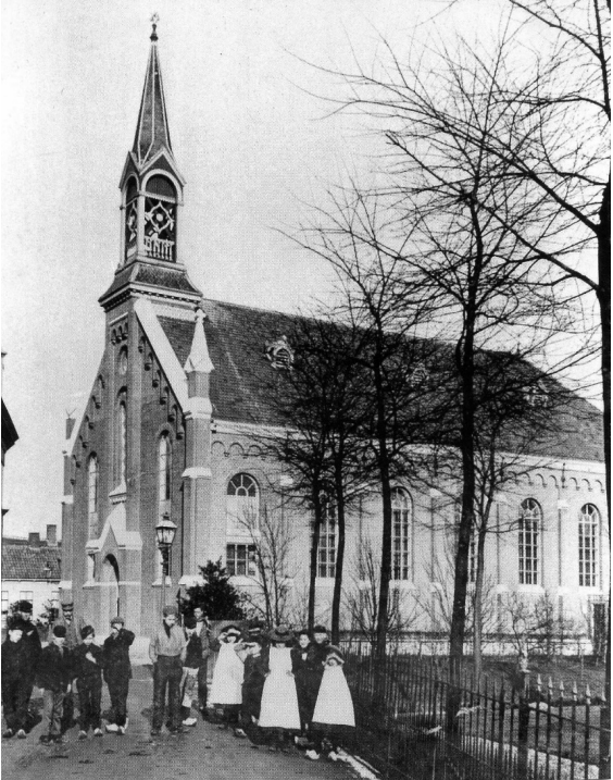
De Gereformeerde Kerk te Alphen aan de Rijn.