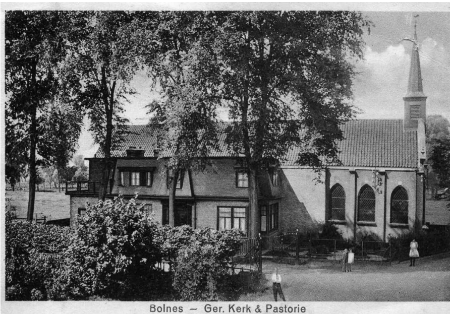
Bolnes — Ger. Kerk & Pastorie