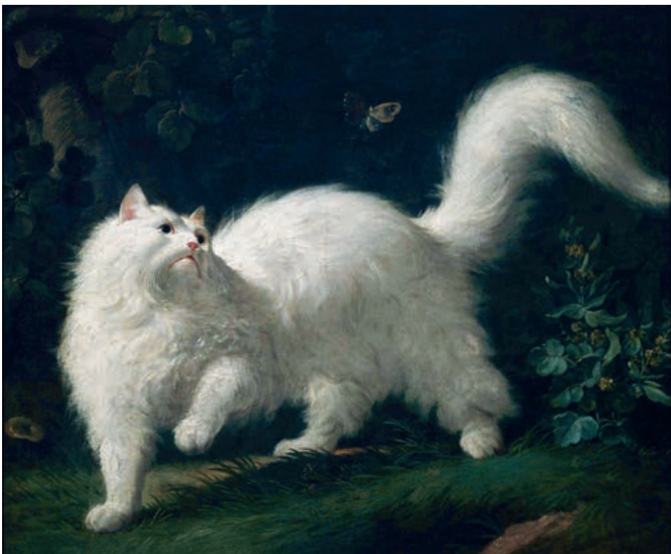
Jean-Jacques Bachelier, Chat angora blanc, guettant un papillon (Witte angorakat loert naar een vlinder), ca. 1760.

De meeste raskatten zijn pas in de 19de eeuw ontstaan door toedoen van de mens. Een zestiental natuurrassen bestonden al langer omdat ze zich in de loop der tijd spontaan ontwikkelden. De elegante angorakat met haar lange witte vacht is hier een van. Zij was zeer geliefd bij de aristocratie in de 18de eeuw. Een uniforme witte pels komt bij katten in het wild zelden voor. Alle wilde katten hebben dezelfde grijsgestreepte vacht. Natuurlijke mutaties, zoals een uniforme witte of zwarte pels, traden pas op nadat de kat bij de mens was ingetrokken.