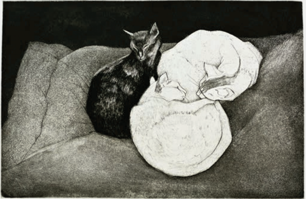
Slegers, Drie poezen , ca. 1970.