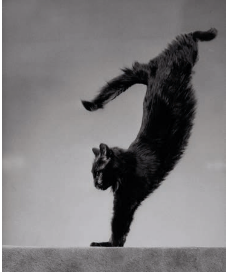
Gjon Mili, Blackie , januari 1943.

De Albanees-Amerikaanse fotograaf Gjon Mili (1904–1984) experimenteerde met de techniek van stroboscopisch licht en de elektrische flits om beweging over tijd te kunnen vangen op beeld. In de jaren 1940 is zijn kat Blackie het onderwerp van veel van zijn foto's.