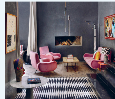
Riad El Fenn