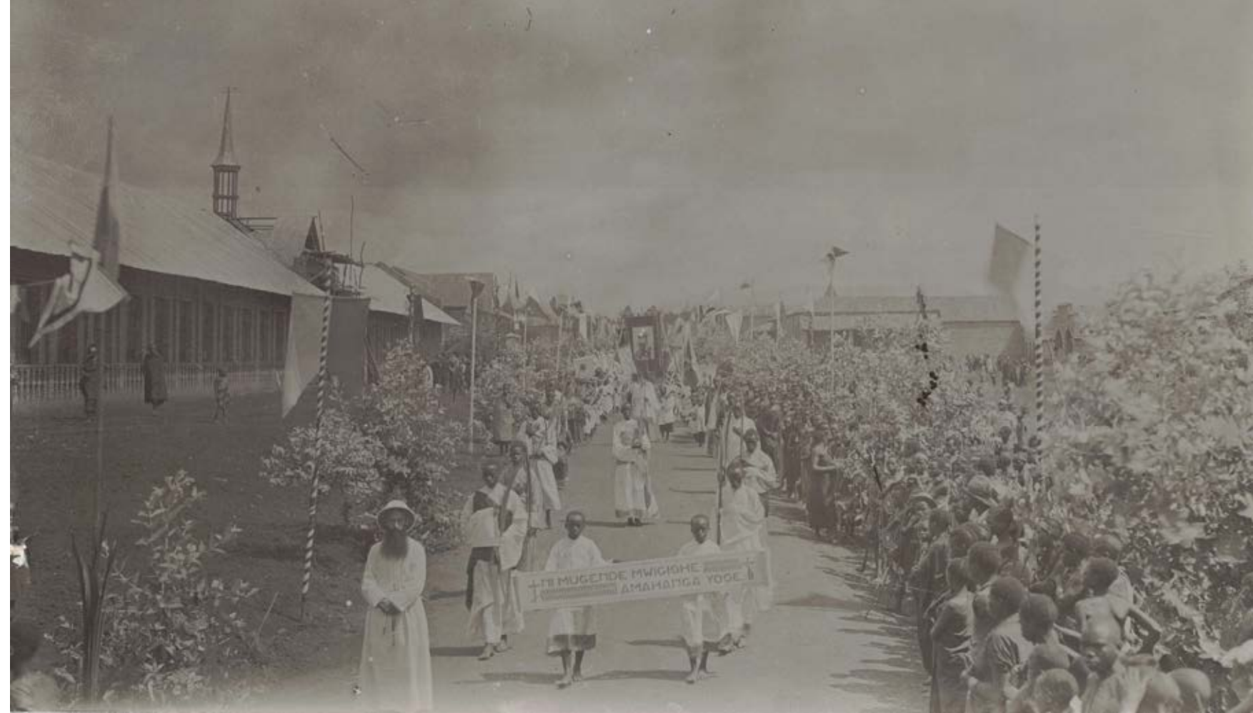
↓ Pater Omer met zijn twaalf 'kruisridders'...

Op die raakpunten bouwde de kerk haar kerstening. Wat bestond, werd vervangen door iets anders, een christelijke variant.