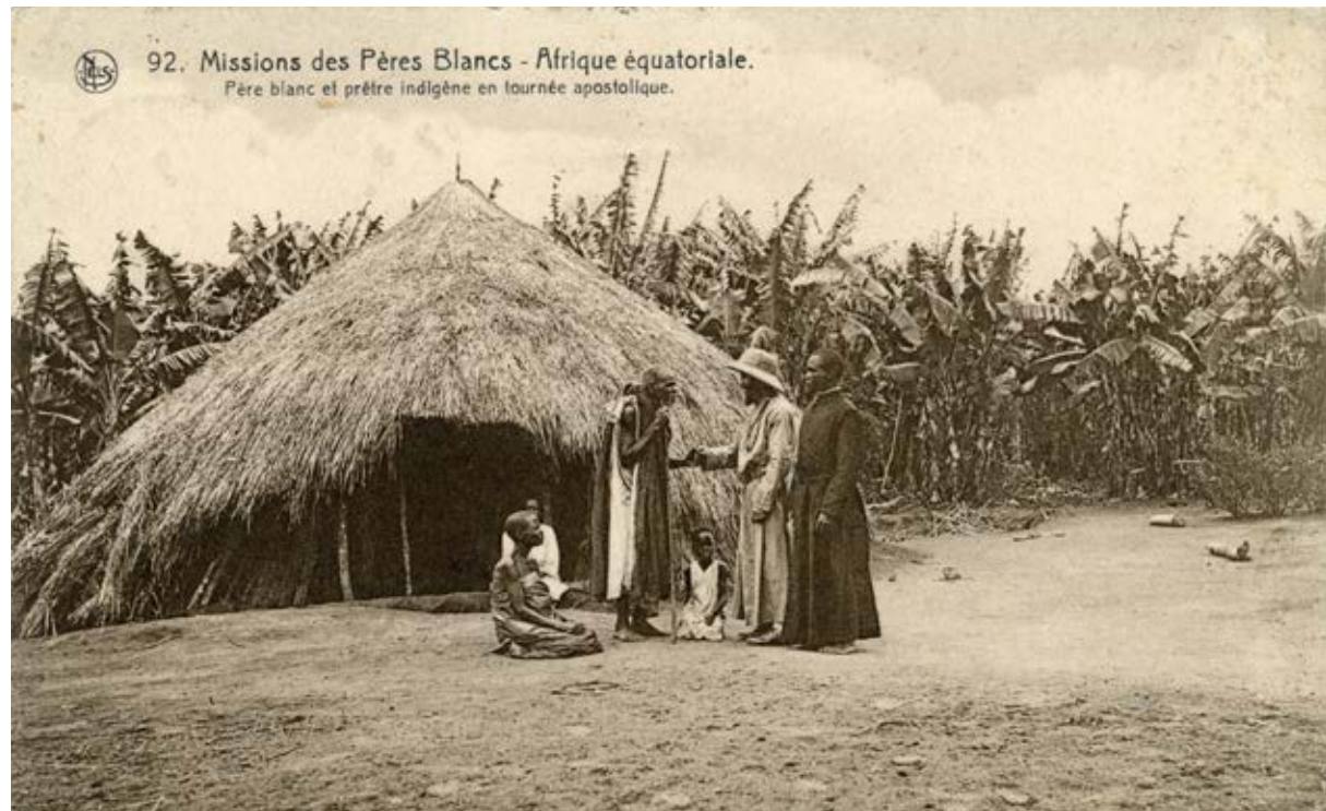
† De blanke missionaris profileert zich als de leider, zijn zwarte confrater eerder als de assistent...

[36]Père blanc et prêtre indigène en tournée apostolique, (Equatoriaal Afrika), prentbriefkaart (Nels), ca. 1920.