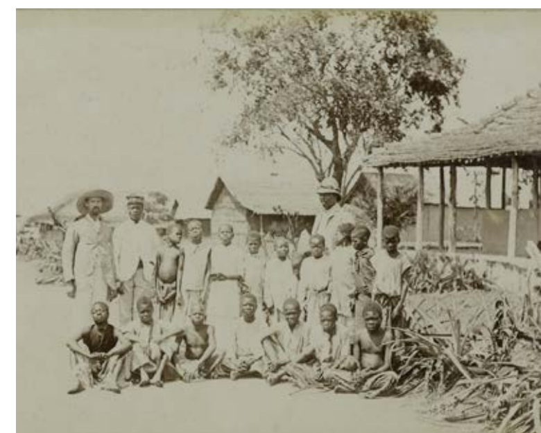
† Het tafereel doet denken aan een klasfoto...

Foto 1 [34]. Een protestantse zending en zijn twee Afrikaanse helpers poseren met een groep leerlingen. Ze zijn met niet meer dan twintig. Het tafereel doet denken aan een klasfoto en dat is het waarschijnlijk ook.