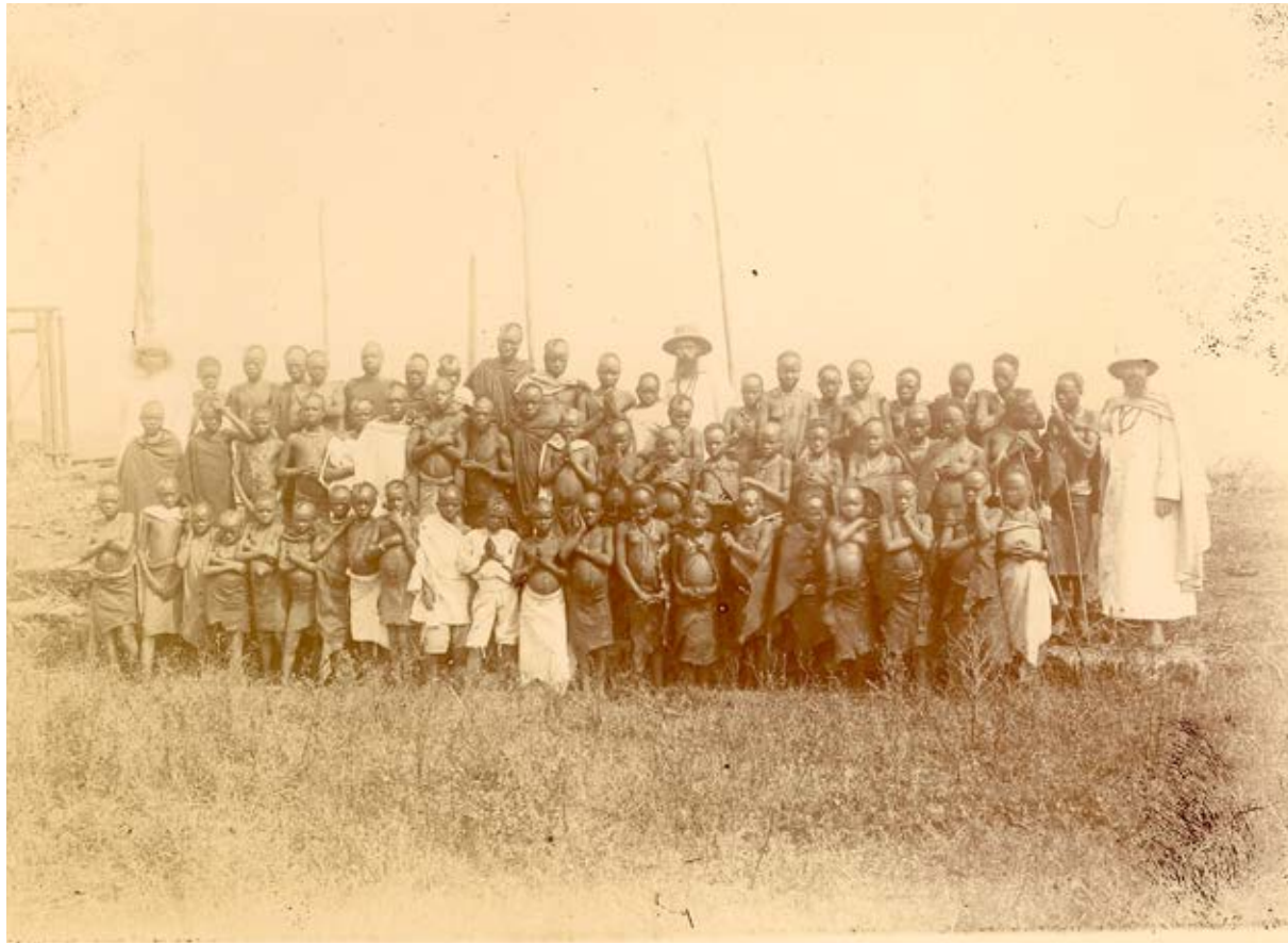
1 Twee Witte Paters poseren voor een groepsfoto met de nieuw gedoopten...

[35][Onbekende fotograaf], Groepsfoto van de nieuw gedoopten, Tongres-Sainte-Marie in Lulenga (Boven-Congo), foto, 15/08/1917.