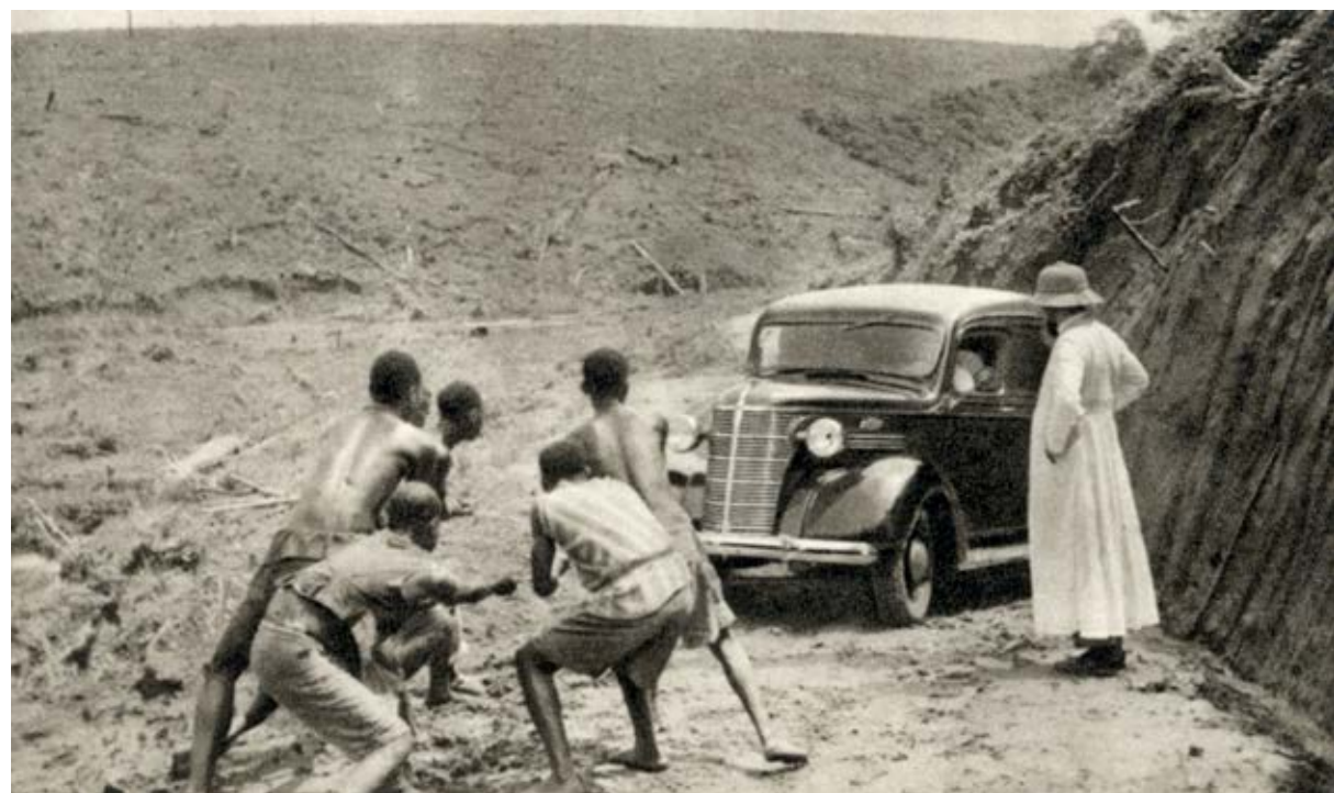
† Een vijftal jongens van de missiepost mogen met de pater mee. Om zijn bagage te dragen...

[32][Onbekende fotograaf], Een redemptorist op missietocht, Kionzo (Matadi), prentbriefkaart (PHOB), ca. 1915.