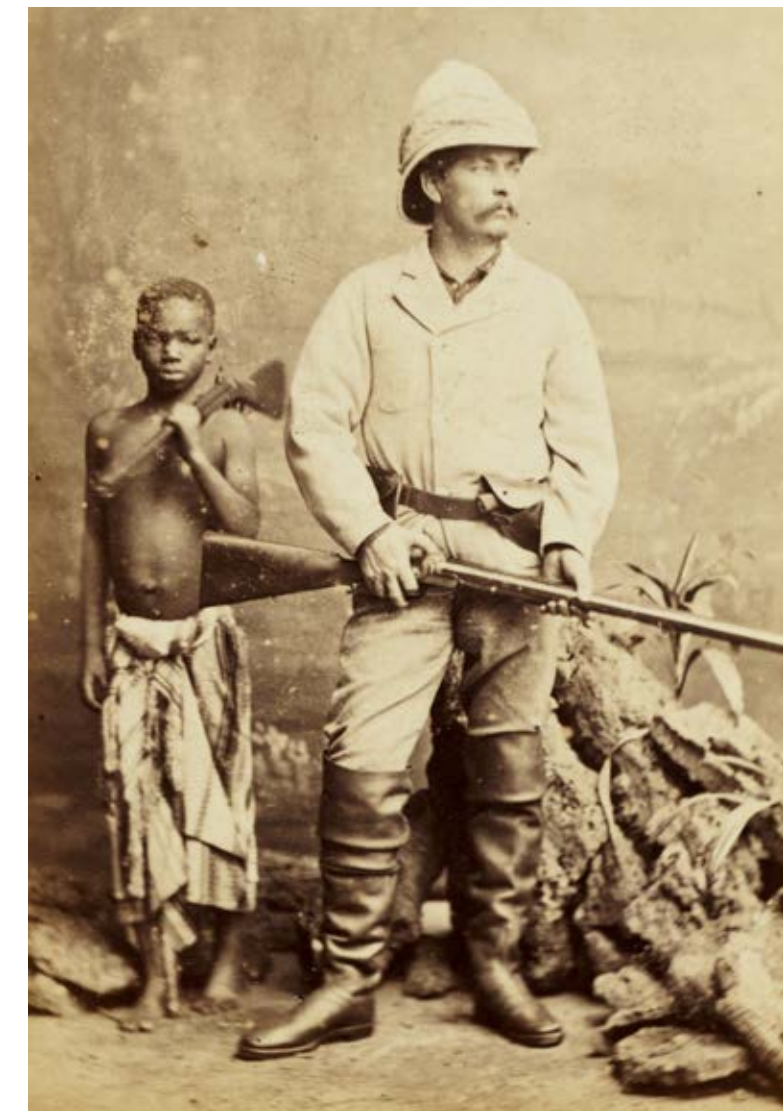
† Kalulu staat er wat afwezig bij. Herleid tot een rekwisiet ...