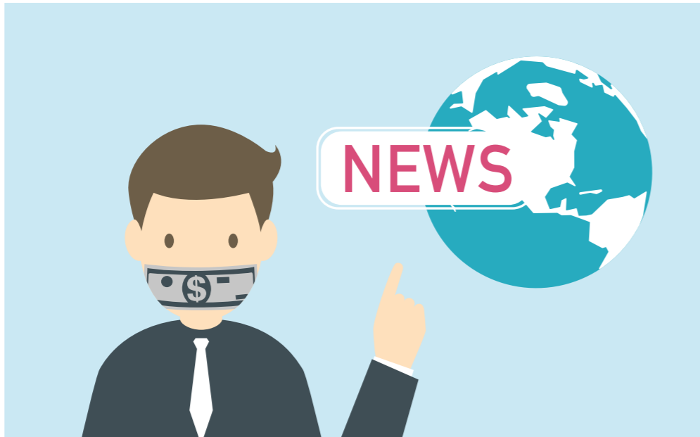
Afbeelding 11.4: Schadelijke neveneffecten vanuit democratisch oogpunt door beperkte invulling van 'vrije media'?