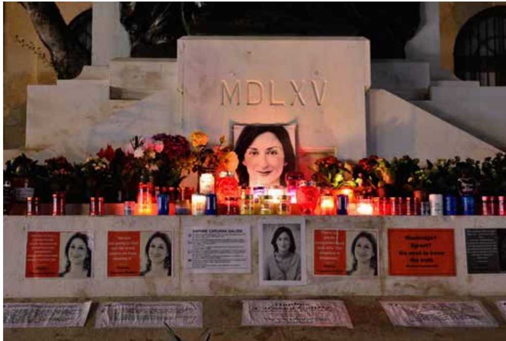
Afbeelding 11.1: Gedenkteken voor de vermoorde journalist Daphne Caruana in Valletta, Malta

onpartijdig kon zijn aangezien de hoofdonderzoeker naar de moord getrouwd was met een minister (Committee to Protect Journalists, 2021). Een mediasysteem (zie ook hoofdstuk 9) in het ene of andere model plaatsen is dan ook niet zo eenvoudig en verschillende mengvormen bestaan.