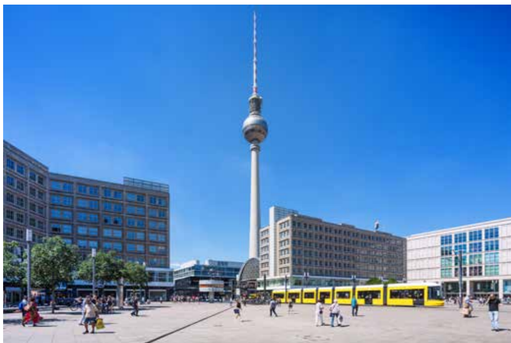
Afbeelding 11.2: De iconische tv-toren, gezien vanop Alexanderplatz in Berlijn, opgericht tussen 1965 en 1969 door het toenmalige DDR-regime als symbool voor de stad en communistische macht

collectieve propagandist, is wellicht de meest duidelijke en benadrukt het persuasieve karakter van de media opdat iedereen overtuigd wordt dat het socialisme nodig is. De andere functies liggen minder voor de hand, maar komen erop neer dat de media een belangrijke rol spelen in het leiden en het controleren van de publieke opinie enerzijds (collectieve organisator) en het mobiliseren van het volk voor de verwezenlijking van de socialistische samenleving anderzijds (collectieve agitator). Van de drie ‘klassieke’ opdrachten van de media (educatie, informatie en ontspanning) wordt vooral de eerste naar voren geschoven. De media vervullen in communistische landen een cruciale rol inzake het ‘vormen’ en ‘opvoeden’ van de massa. Informatie is eveneens belangrijk, maar informatie die de socialistische samenleving ondermijnt, krijgt geen plaats in de media. Ontspanning is ten slotte nauwelijks aanwezig, aangezien dat niet strookt met het collectieve karakter van de media ((Siebert et al., [1956] 1963, pp. 112-117; Altschull, [1984] 1995, pp. 209-223).