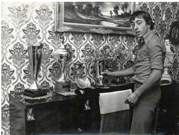
Thuis staat intussen al een reeksje bekers.