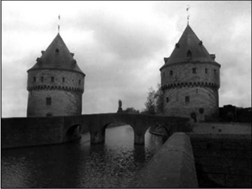
De Broeltorens, de enige overblijfselen van de verdedigingswerken van Kortrijk

Hierbij werden het nog nieuwe kasteel, de citadel en praktisch alle muren en torens werden opgeblazen of met houwelen vernield. Nu alle versterkingswerken met de grond gelijk waren gemaakt en ook grachten waren gedempt was Kortrijk een open, onbeschermd stad geworden. Tijdens de bloedige Negenjarige Oorlog, die woedde van 1688 tot 1697, zorgden het geweld, een graancrisis en ziekten ervoor dat een kwart van de bevolking van de Kortrijk kwam te overlijden. In die periode namen de Franse legers de stad wéér in en startten ze opnieuw met de aanleg van verdedigingswerken, die ze aan het eind van de oorlog nogmaals vernielden. Al die machtswisselingen gingen met veel geweld gepaard. Vaak werden de overwonnenen voor de ogen van de burgers van de stad - meestal midden op het marktplein of voor het Raadhuis - gemarteld en gedood en werden hun restanten nog tijden lang ten toon gesteld. Ook onze voorouders zullen dergelijke taferelen hebben moeten aanschouwen.