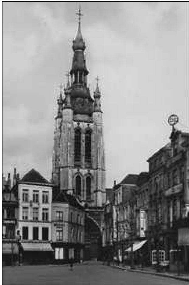
St. Martinuskerk in Kortrijk