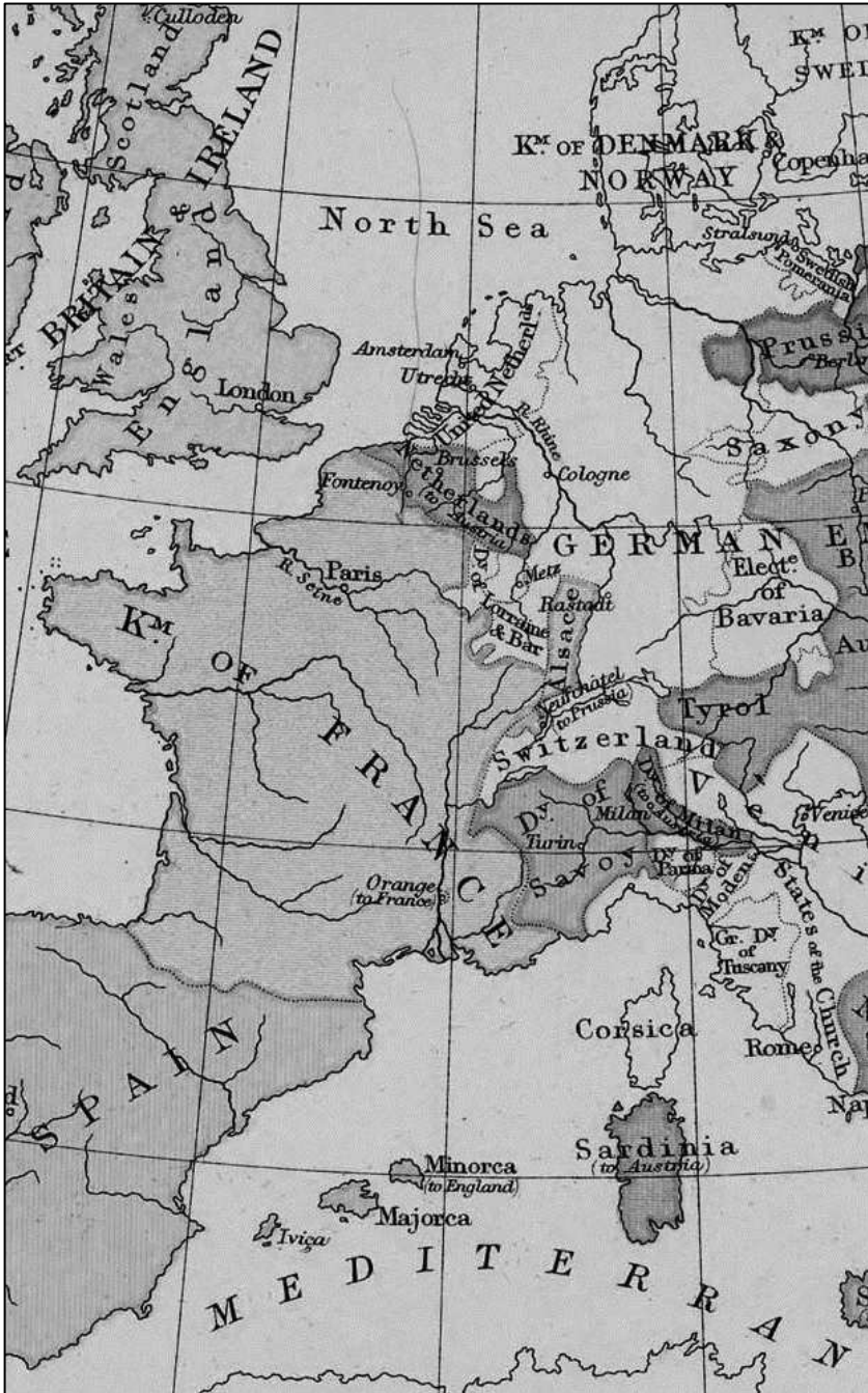
West-Europa na de Vrede van Utrecht (1713)