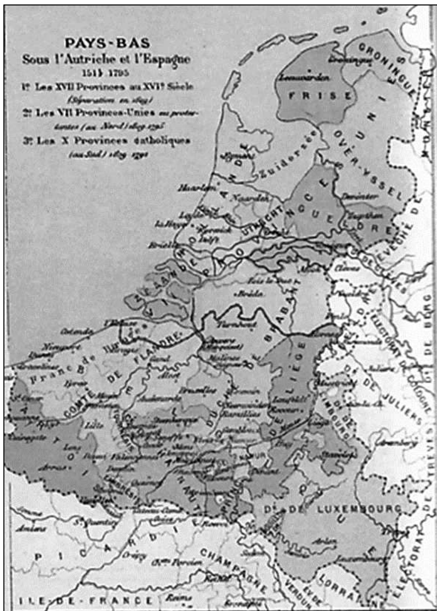
De Noordelijke en Zuidelijke Nederlanden in de 18 e eeuw (onder Spaans en Oostenrijks bewind)