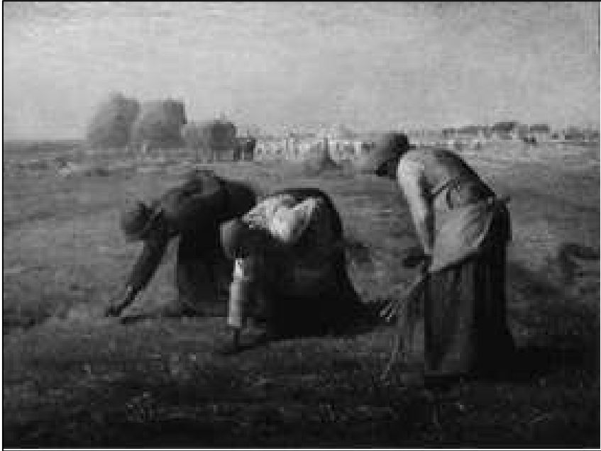
Het Vlaamse platteland in de 17e eeuw