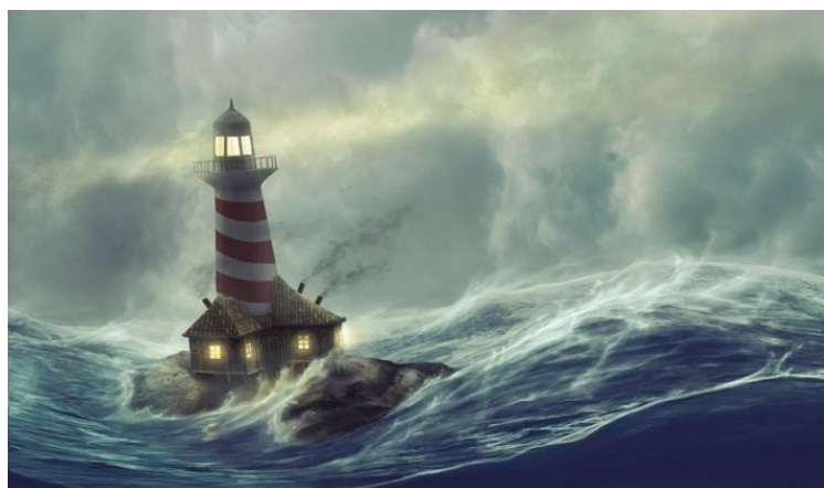
The Forwarded Lighthouse