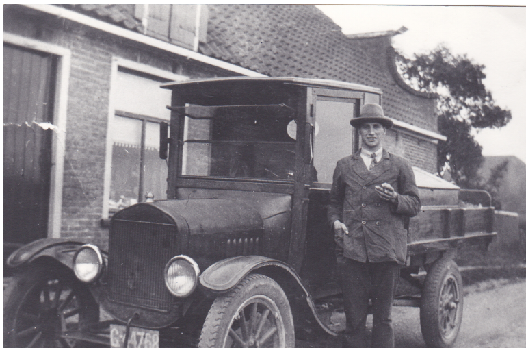
Vader bij de auto

Mijn vader was een man van grote tegenstellingen: Ouderling en conferencier, schrijver van doodsgedichten en kwajongensboeken, onverbeterlijke zwartkijker en onnavolgbare humorist. Een man van letterlijk twaalf ambachten en dertien ongelukken. Maar ondanks, of misschien wel dankzij alles, iemand aan wie je de dierbaarste herinneringen bewaart.