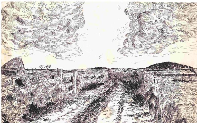
Texel, pentekening van de auteur

Indonesië, Zwitserland en Spanje... Maar toch moest ik tenslotte opnieuw kiezen voor Texel. Net zoals Roland Holst koos voor 'het aangaan van de nacht bij de Hondsbosse' boven 'de aanblik van de welige Apennijnen.'