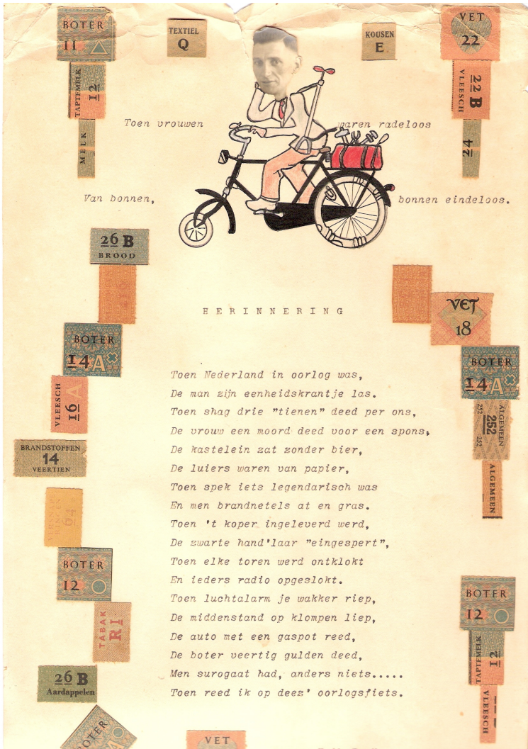
Vader op zijn oorlogsfiets

Kort na de oorlog werd het boek onder de titel van 'De avonturen van Kikker', uitgegeven bij Kluitman in Alkmaar. Het werd goed ontvangen en kreeg zelfs een plaatsje bij de beste boeken van 1946 in 'Wormcruyt met Suycker' van D.L. Daalder. Voor Daalder had