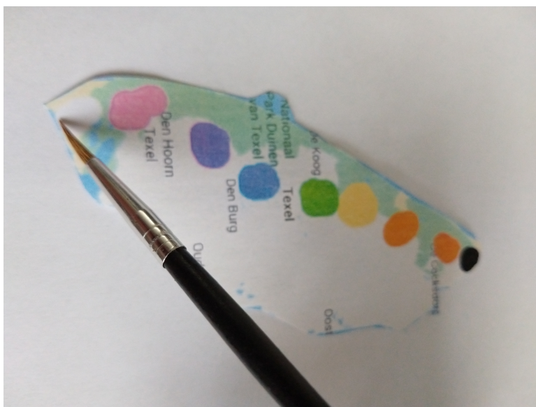
Texel als palet

Texel heeft de vorm van een palet en zo heeft het eiland ook altijd in mijn gedachten bestaan. Met de 'verf' van de dorpen, de landschappen en de vegetatie van het eiland meng ik nog steeds veel herinneringen in mijn leven.