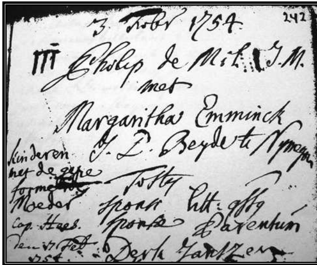
'kinderen met de gereformeerde Moeder'