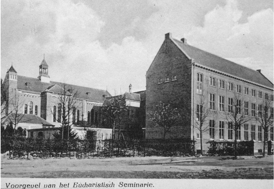
Voorgevel van het Eucharistisch Seminarie.