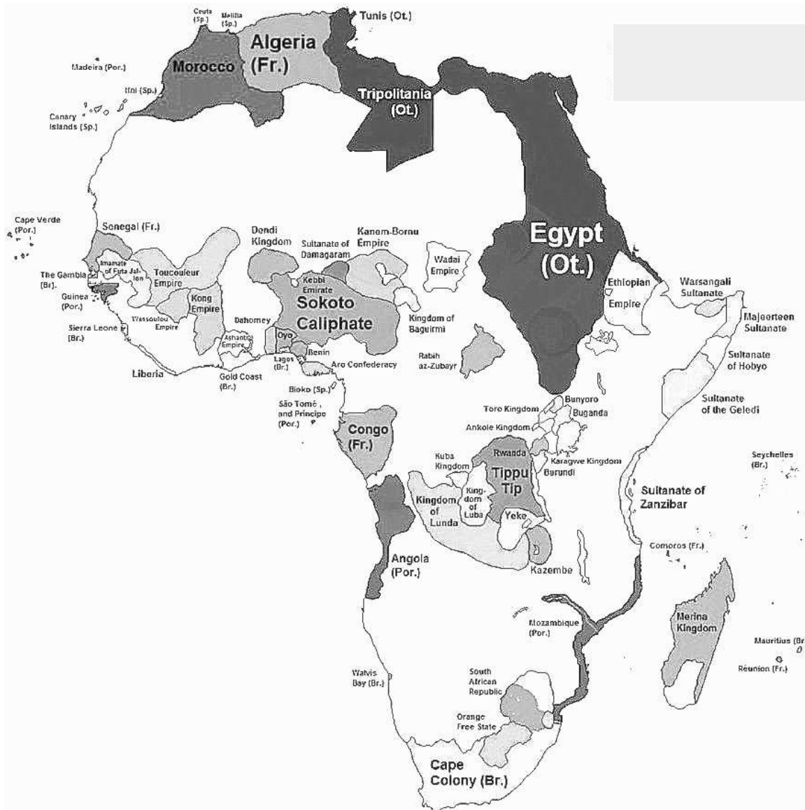
Fig. 1: Kaart van Afrika in 1880, vóór de Europese 'scramble for Africa'.